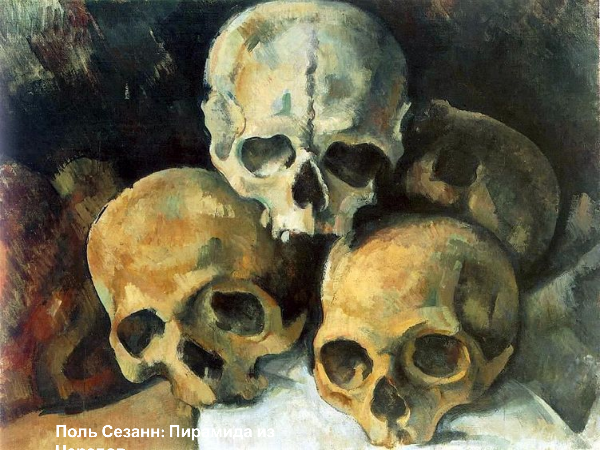
Поль Сезанн: Пирамида из Черепов