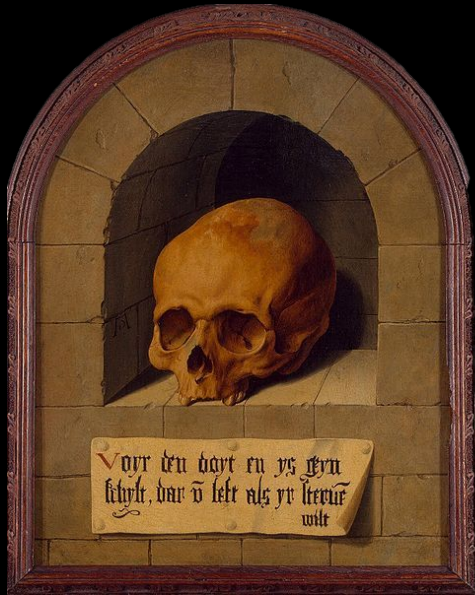
Bartholomeus Bruyn Старший (1493–1555) Череп в нише. Эрмитаж

Vanitas. (лат. vanitas , букв. — «суета, тщеславие») — жанр живописи эпохи барокко, аллегорический натюрморт, композиционным центром которого традиционно является человеческий череп. Подобные картины, ранняя стадия развития натюрморта, предназначались для напоминания о быстротечности жизни, тщетности удовольствий и неизбежности смерти. Наибольшее распространение получил во Фландрии и Нидерландах в XVI и XVII веках. Термин восходит к библейскому стиху: Vanitas vanitatum et omnia vanitas («Суета сует,