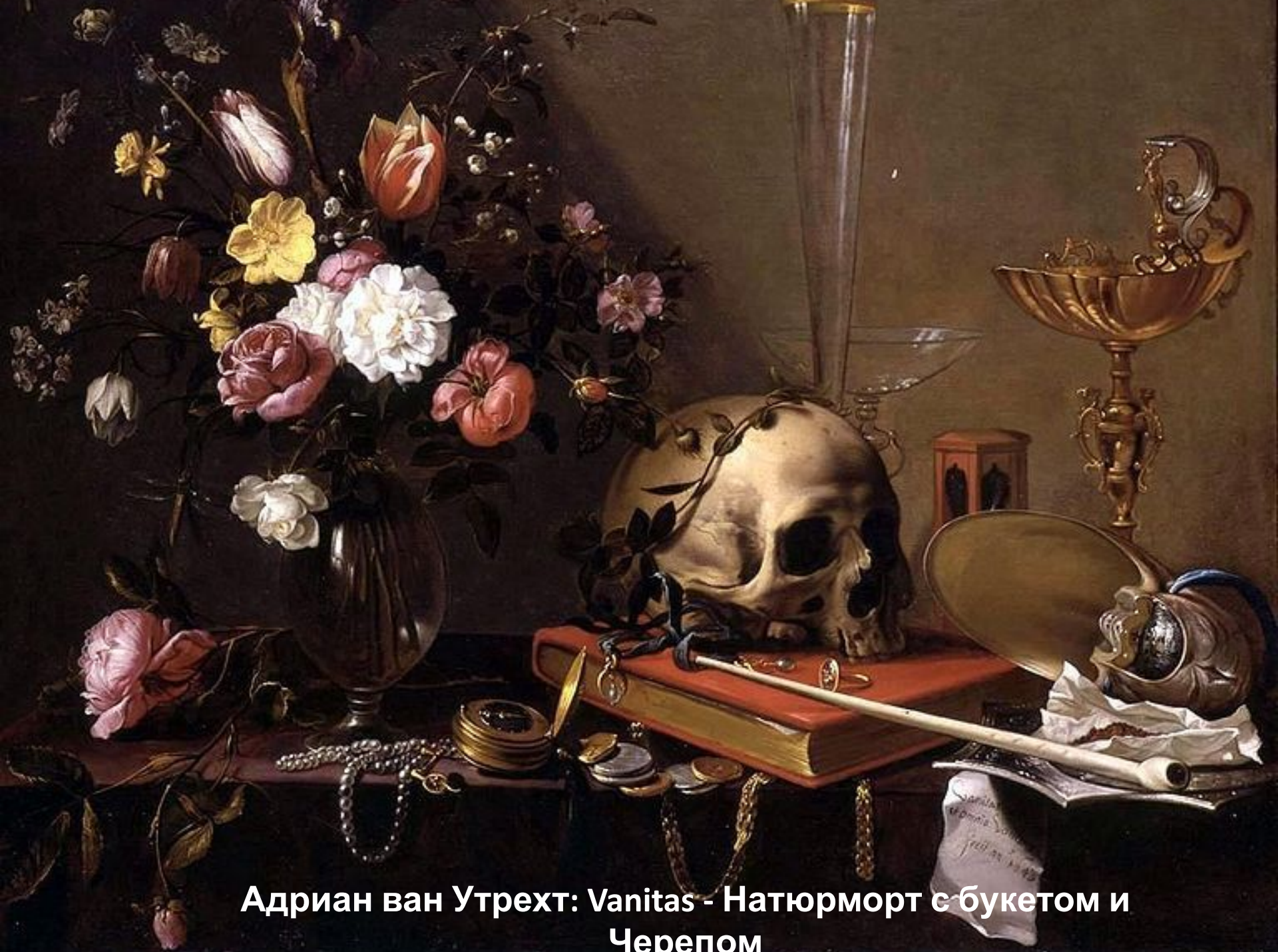
Адриан ван Утрехт: Vanitas - Натюрморт с букетом и Черепом