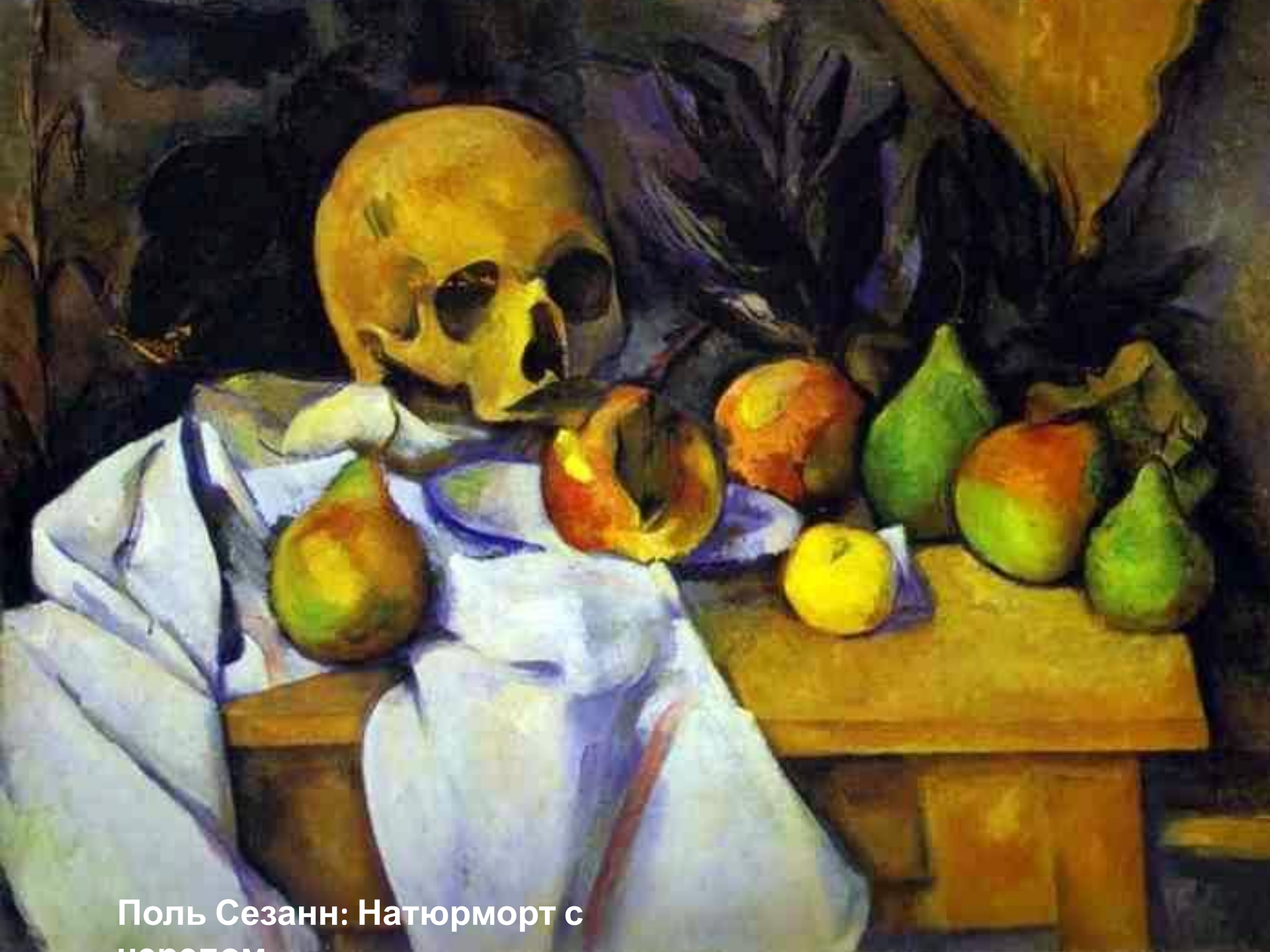
Поль Сезанн: Натюрморт с черепом