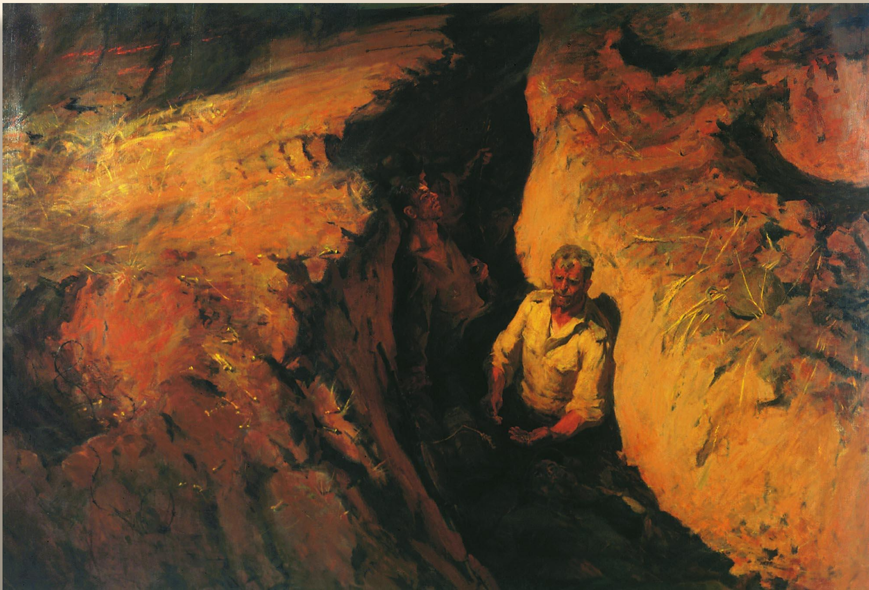
«Земля опалённая». Неменский Б. 1957 г.