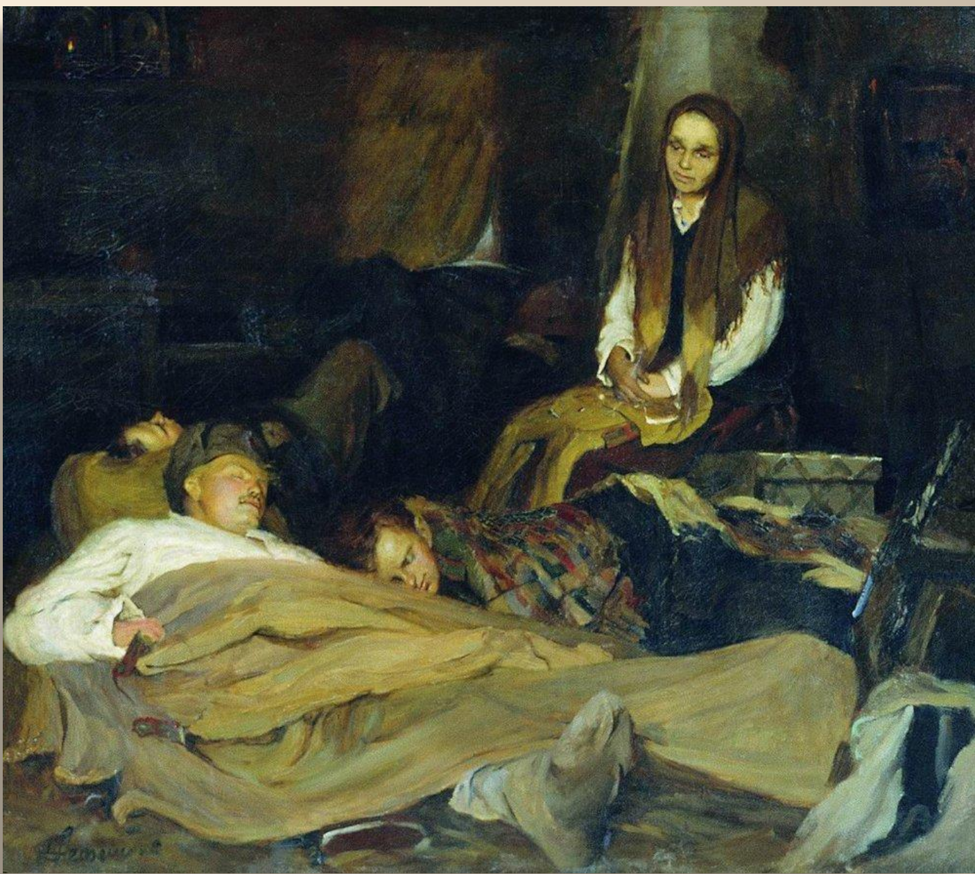
«Мать» Неменский Б. 1945