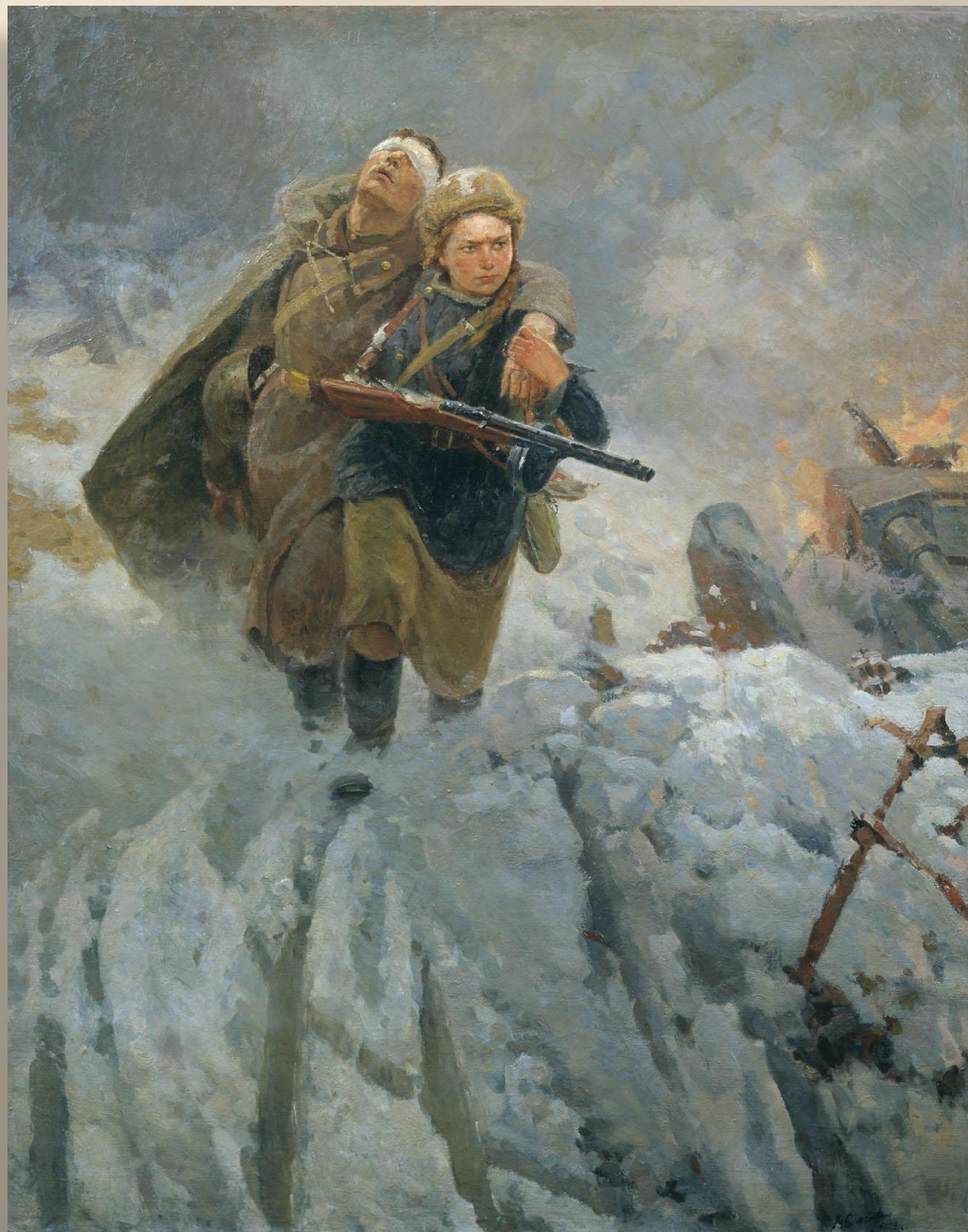
«Сестрица». Самсонов М. 1953 г.