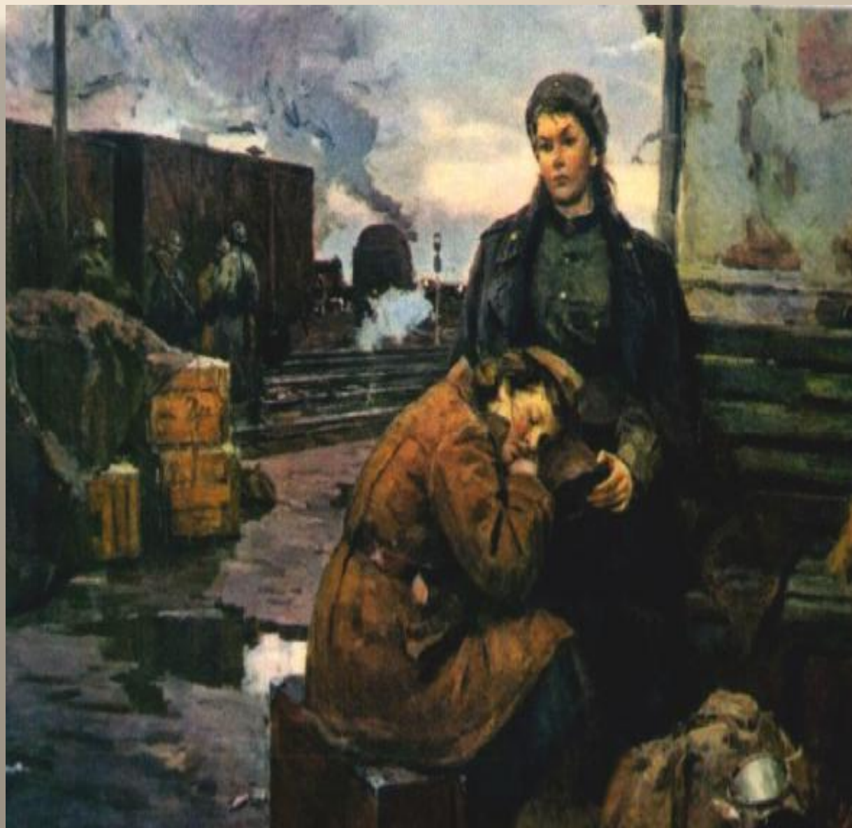
«На дорогах войны». Артамонов В. 1943 г.