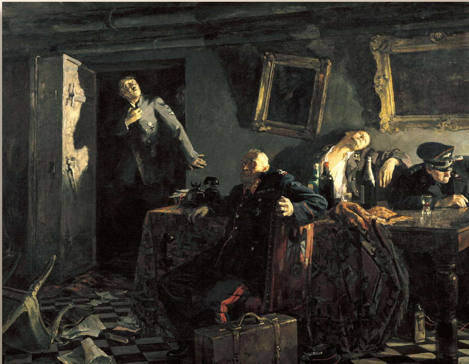
«Конец». Кукрыниксы. 1948 г.