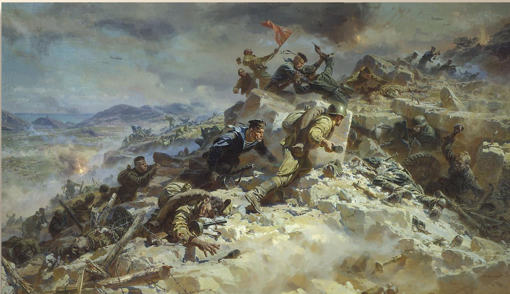
«Штурм Сапун-горы» Мальцев П.Т. 1956 – 1957 гг.