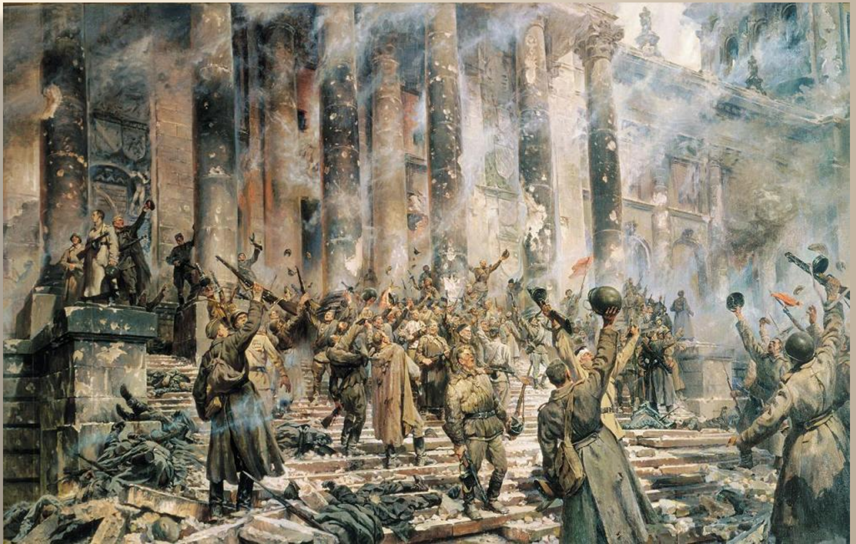
«Победа». Кривоногов П. 1948 г.