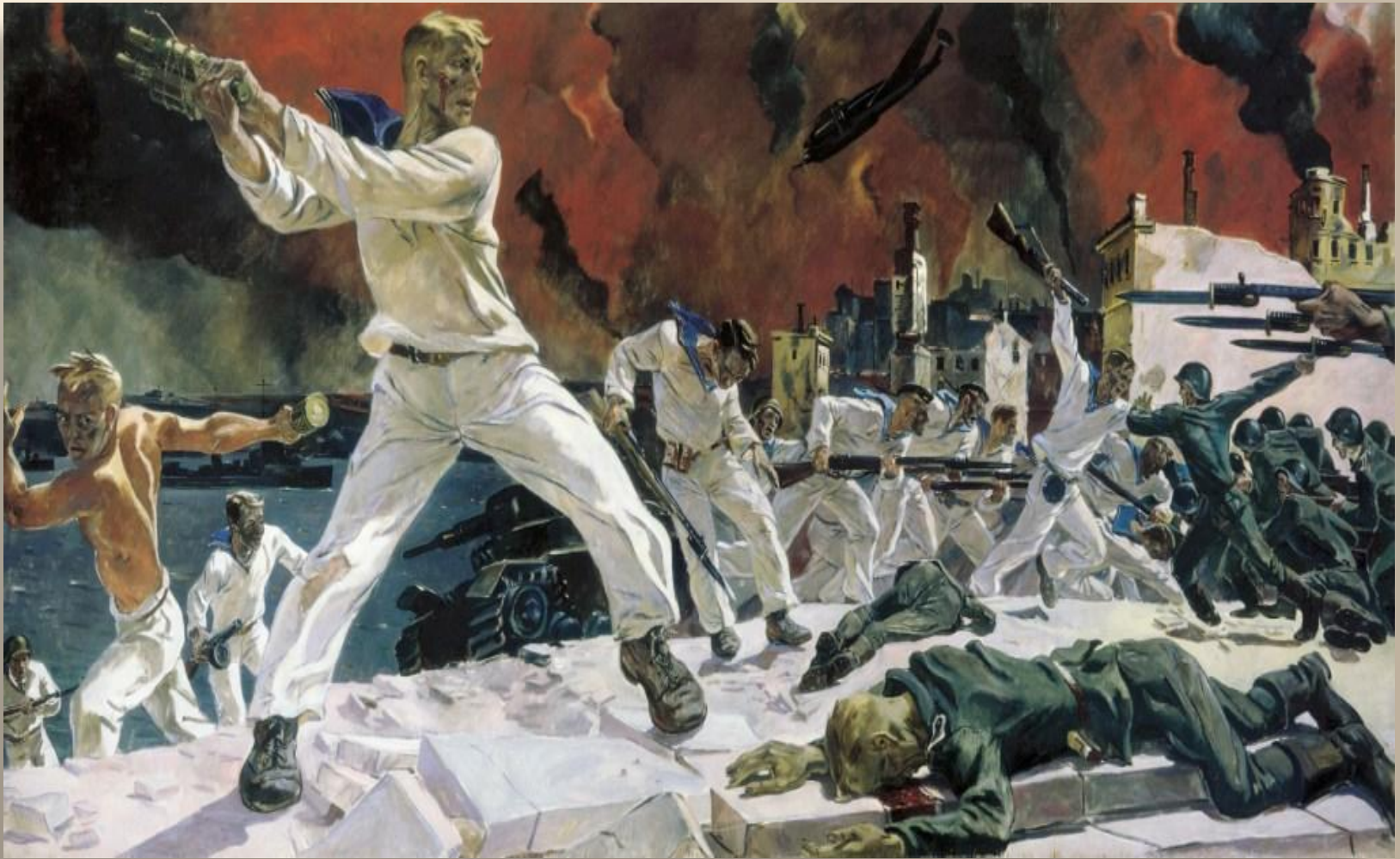
«Оборона Севастополя». Дейнека А. 1942 г.