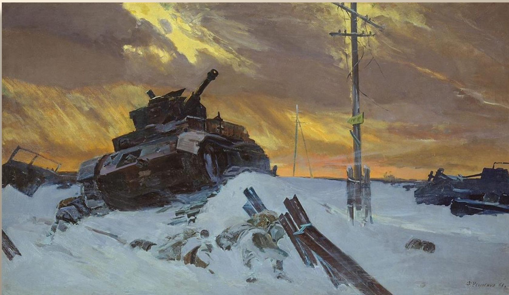
«Враг остановлен» Усыпенко Ф. П. 1949 г.