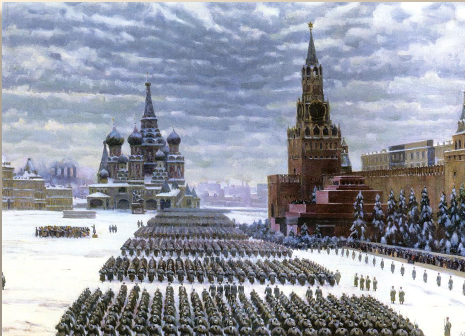
«Парад на Красной площади». К. Юон. 1942 г.