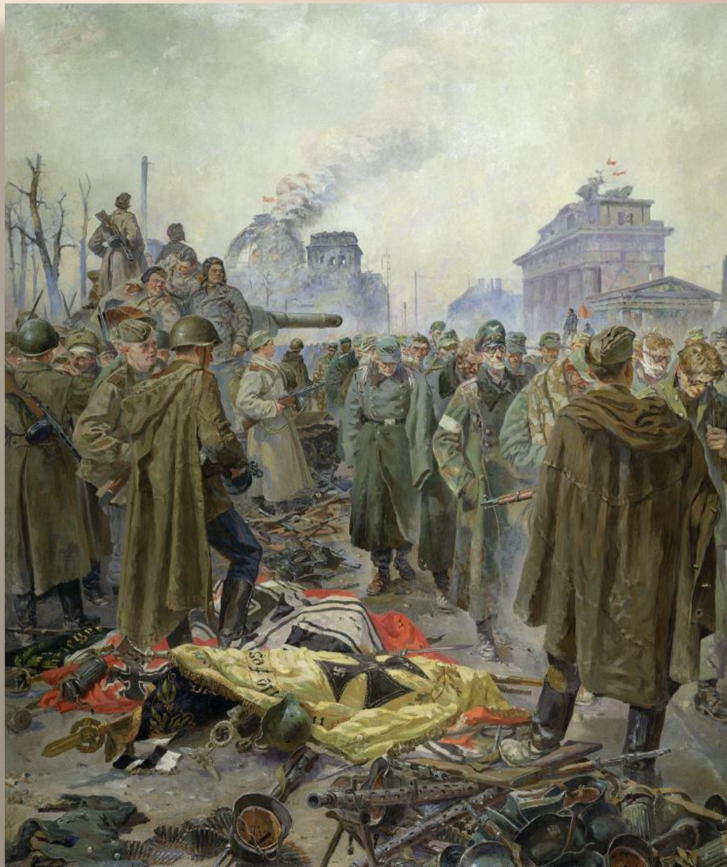
«Капитуляция». Кривоногов П. 1946 г.