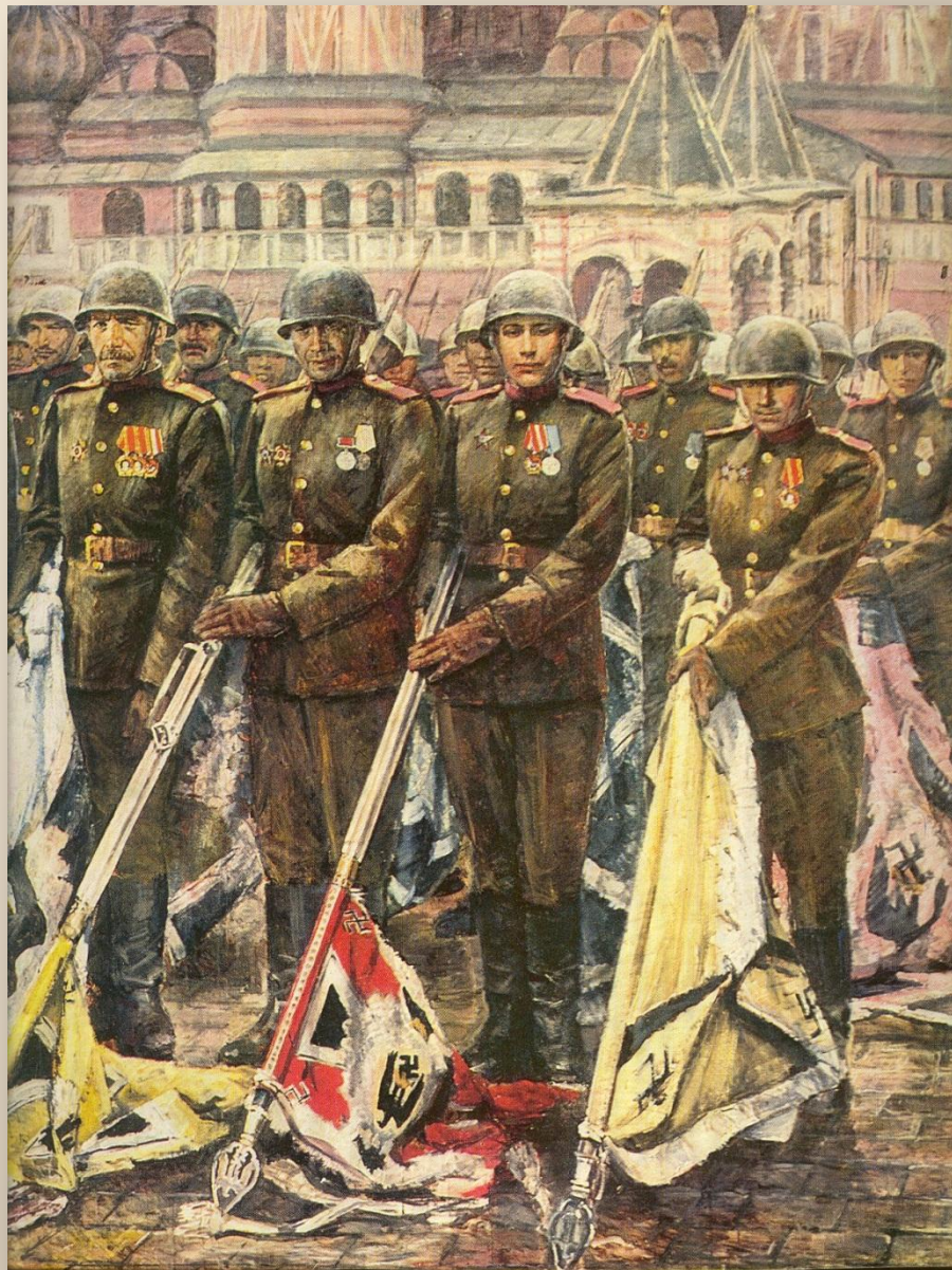
«Победители». Антонов К. М. 1985