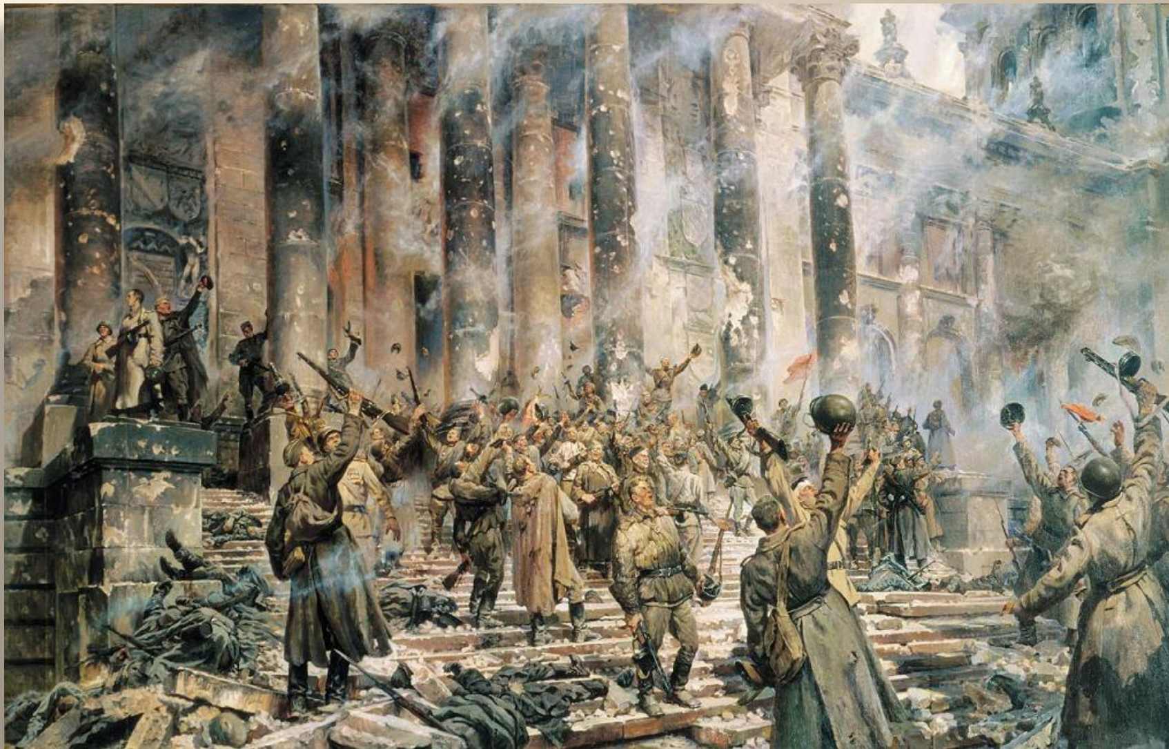
«Победа». Кривоногов П. 1948 г.