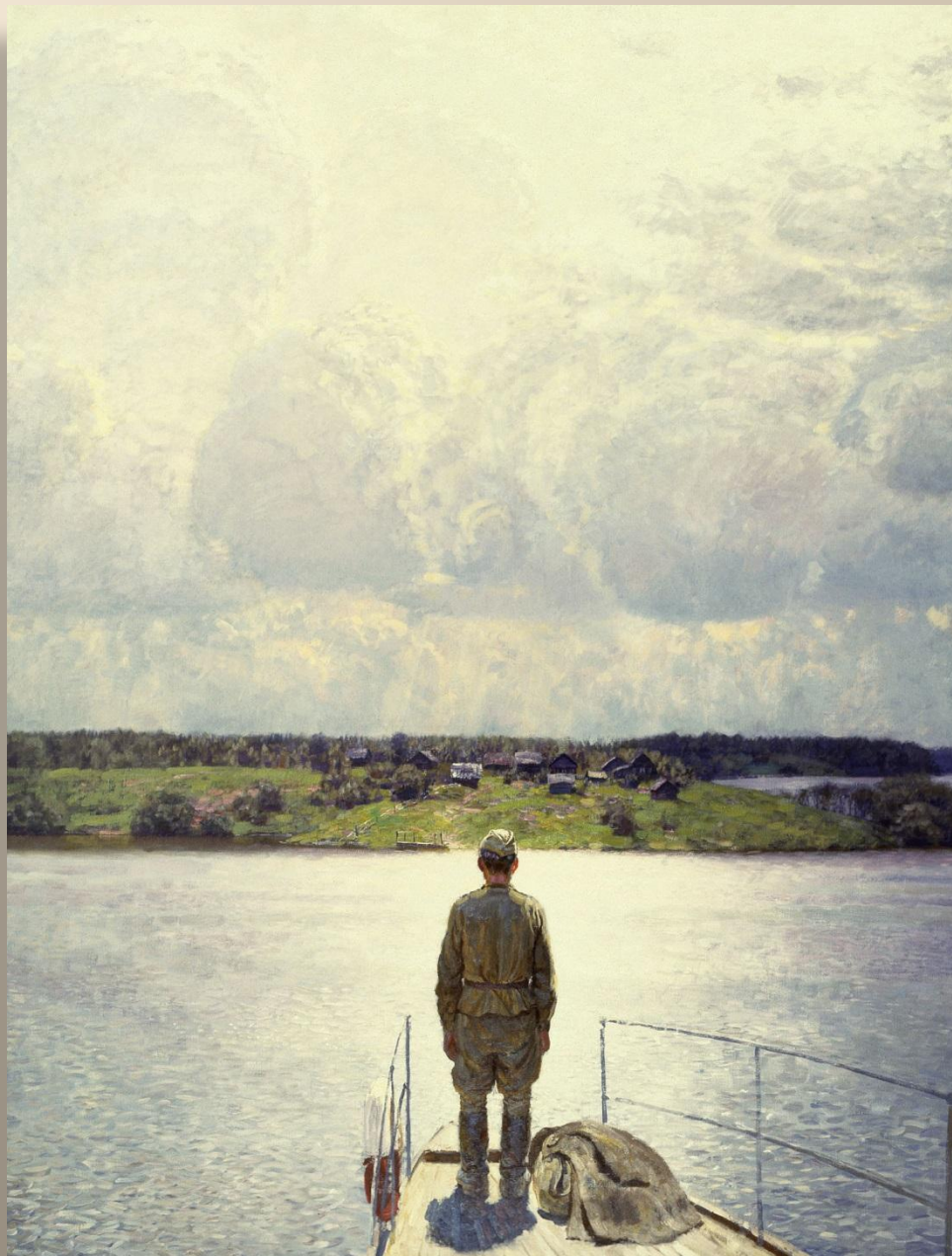
«Возвращение». Кугач М. 1988 г.