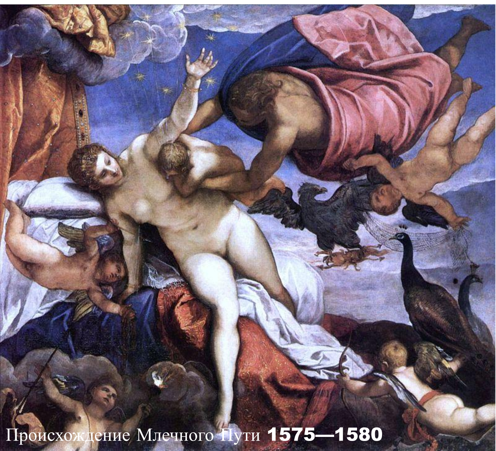
Происхождение Млечного Пути 1575—1580