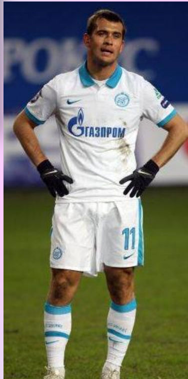
ФУТБОЛКА И ШОРТЫ