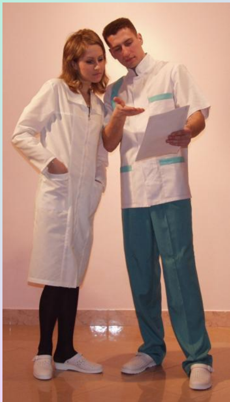
ВРАЧА И МЕДСЕСТРЫ