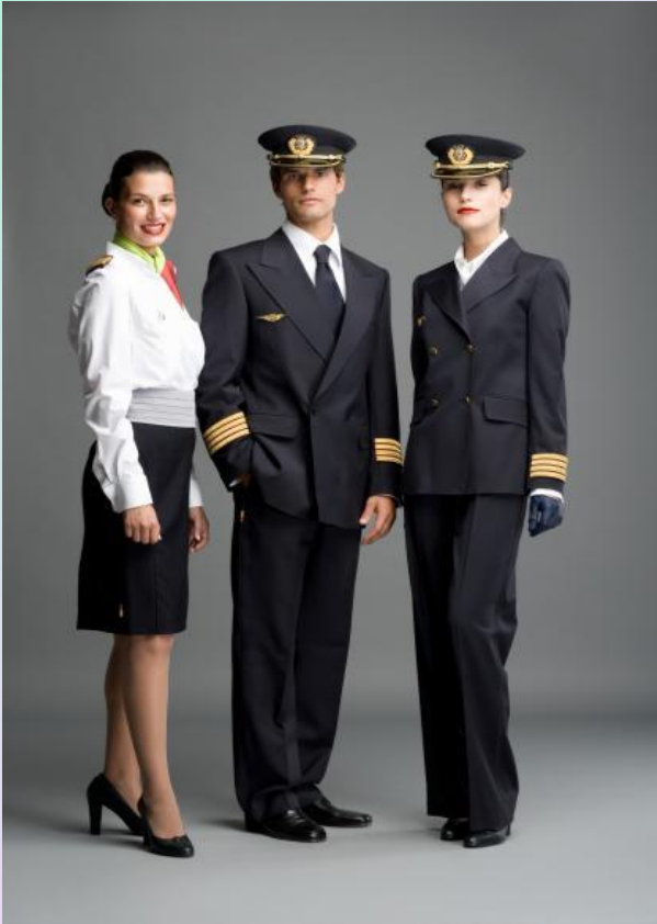
ЛЁТЧИКОВ И СТЮАРДЕСС