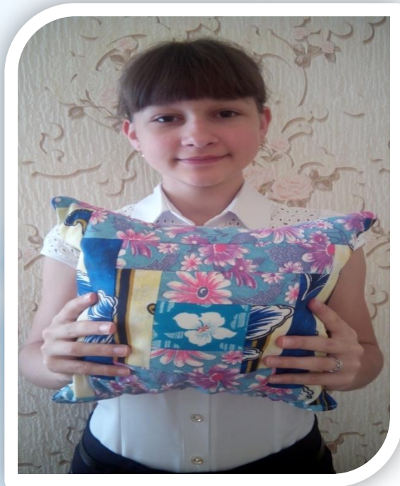
ФОТО виготовленого виробу