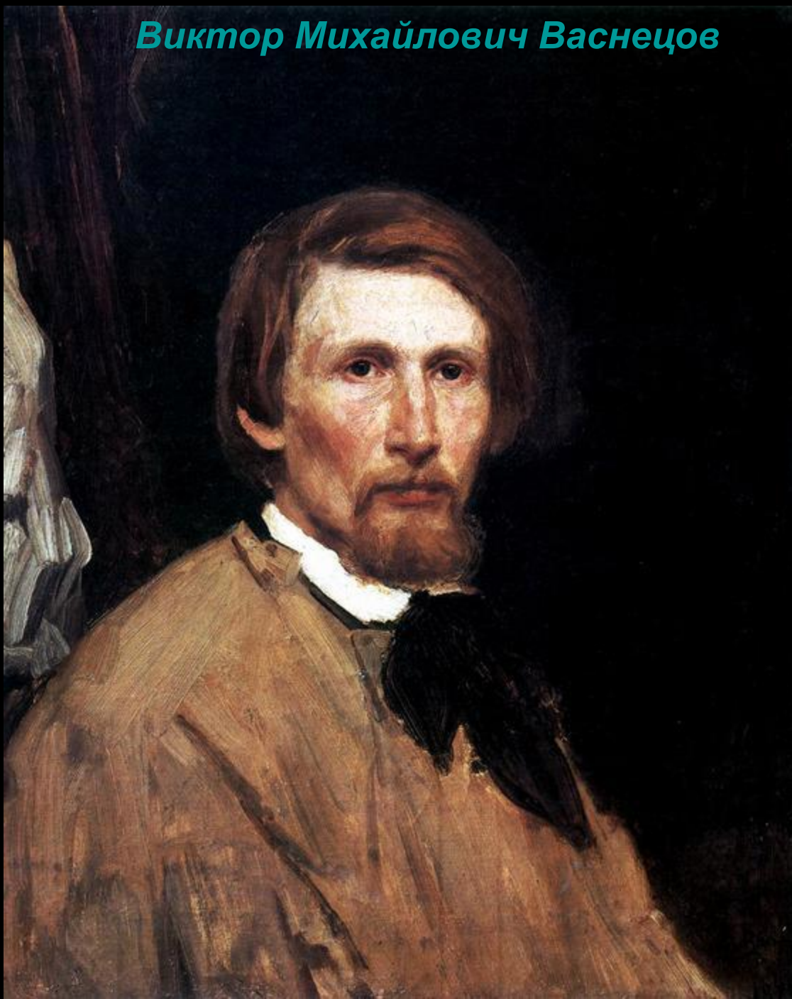
Виктор Михайлович Васнецов