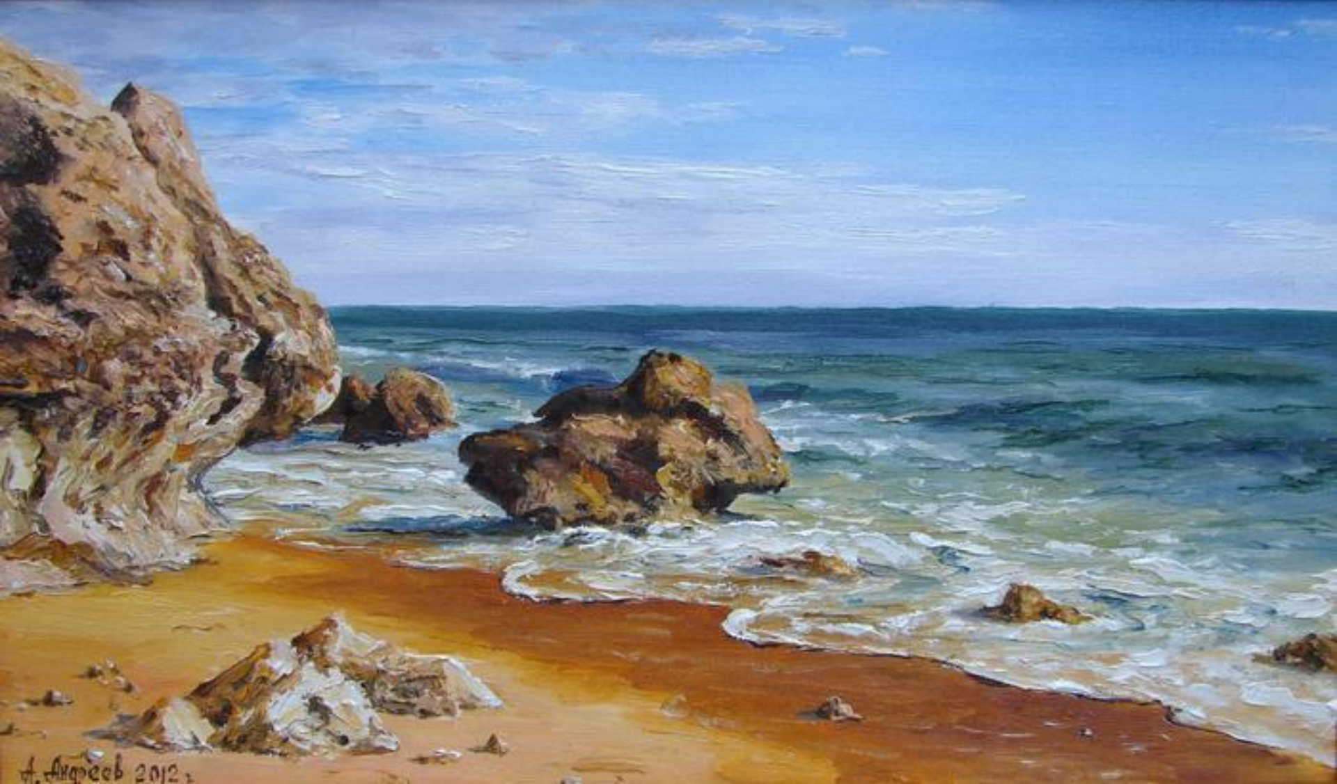
УКРАИНСКИЙ ХУДОЖНИК АЛЕКСАНДР АНДРЕЕВ.