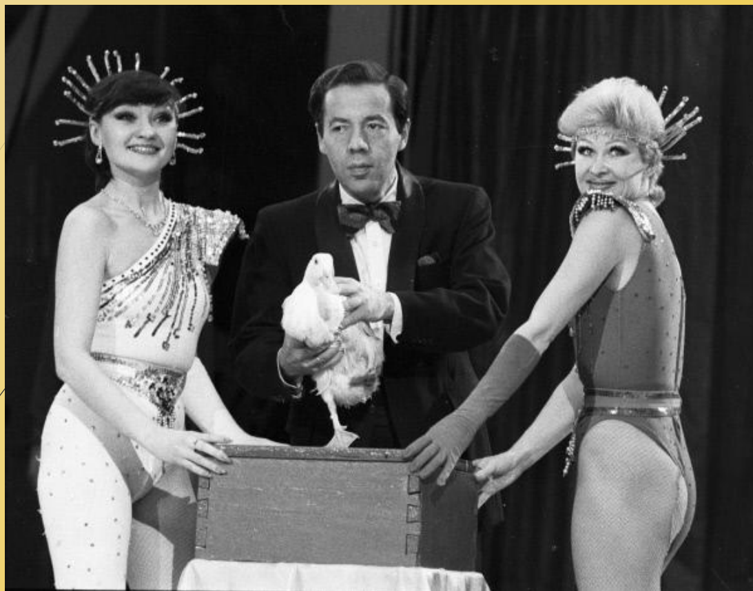
Династия иллюзионистов Кио.