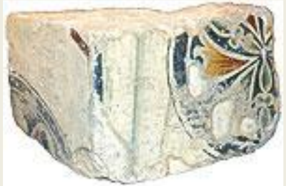
Медальон на пелене из цокольной части декорации.