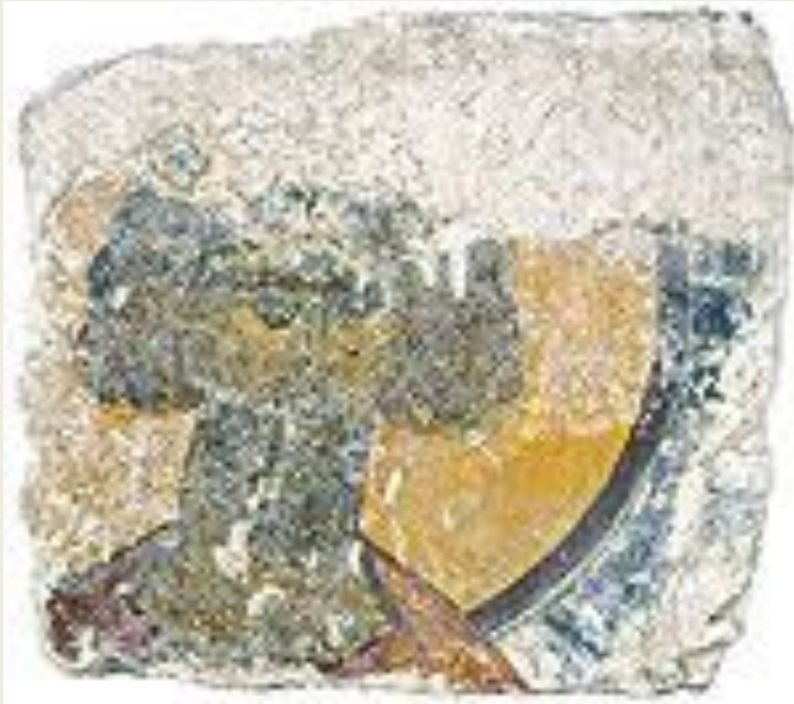
Голова неизвестного святого