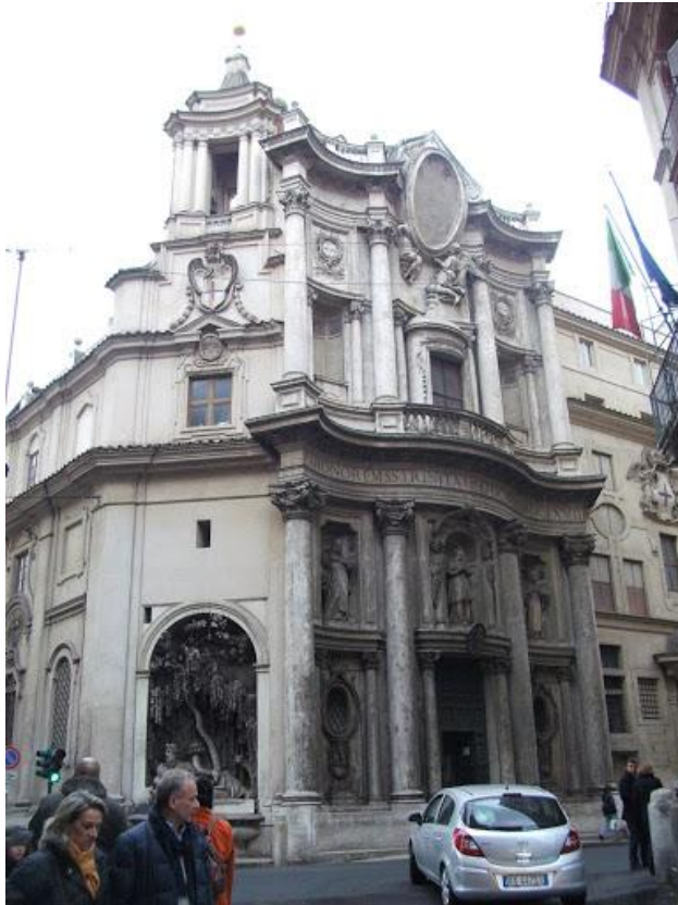
ЦЕРКОВЬ САН-КАРЛО ФРАНЧЕСКО БОРРОМИНИ