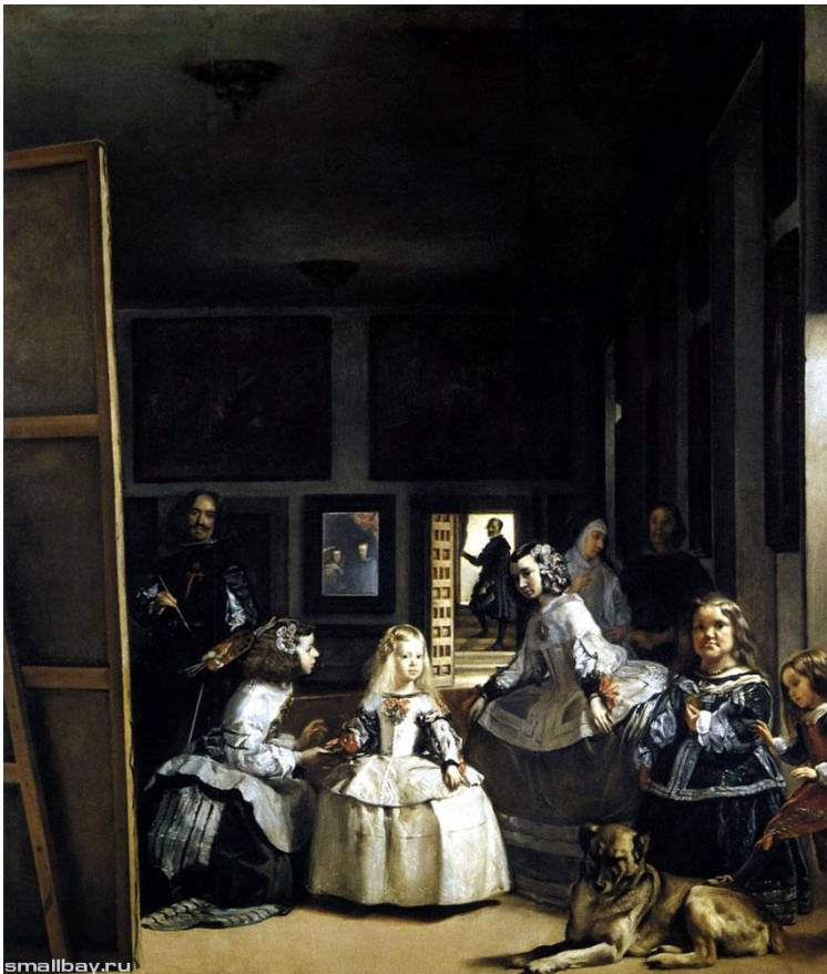
МЕНИНЫ ДИЕГО ДЕ СИЛЬВА ВЕЛАСКЕС