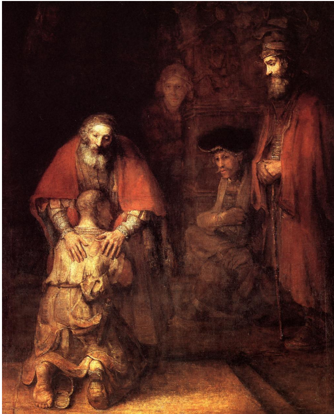
БЛУДНЫЙ СЫН РЕМБРАНДТ