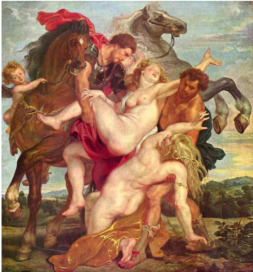
ПОХИЩЕНИЕ ДОЧЕРЕЙ ЛЕВКИППА ПИТЕР ПАУЛЬ РУБЕНС