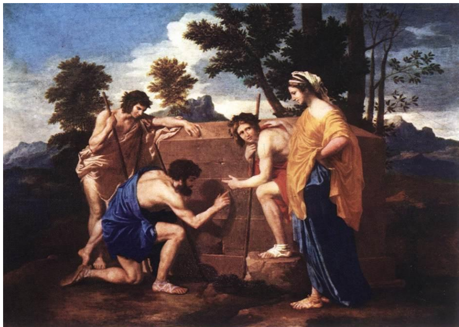
ПАСТУХИ АРКАДИИ НИКОЛЯ ПУССЕН