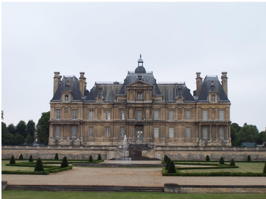
ДВОРЕЦ МЕЗОН-ЛАФФИТ ФРАНСУА МАНСАР