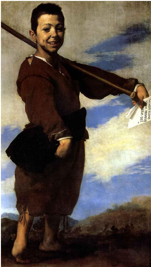
ХРОМОНОЖКА ХУСЕПЕ ДЕ РИБЕРА