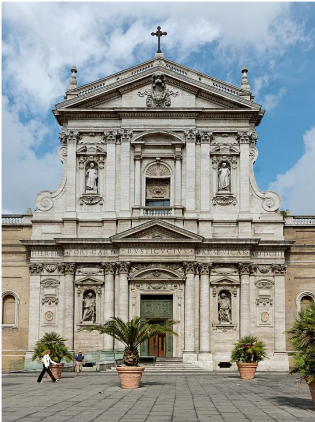
ЦЕРКОВЬ СВ.СУСАННЫ КАРЛО МАДЕРНА