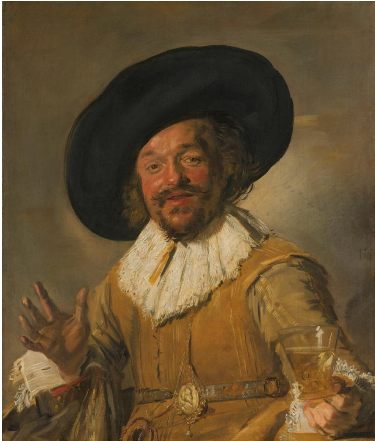
ВЕСЕЛЫЙ СОБУТЫЛЬНИК ФРАНЦ ХАЛЬС