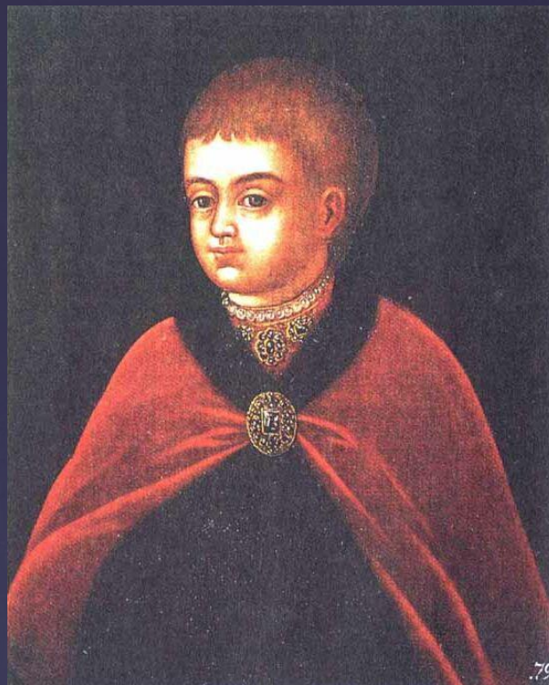
Петр I в детстве