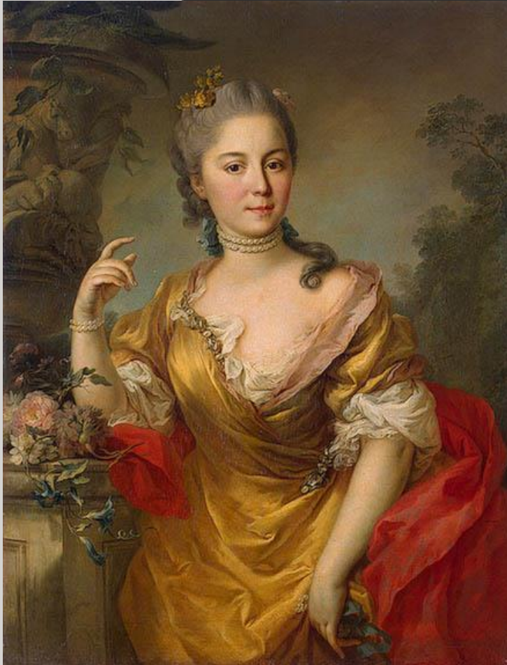
«Екатерина II в виде Минервы»

Костюмированный портрет- портрет , в котором человек представлен в виде аллегорического, мифологического, исторического, театрального или литературного персонажа. Обычно в наименования таких портретов включаются слова "в виде" или "в образе".