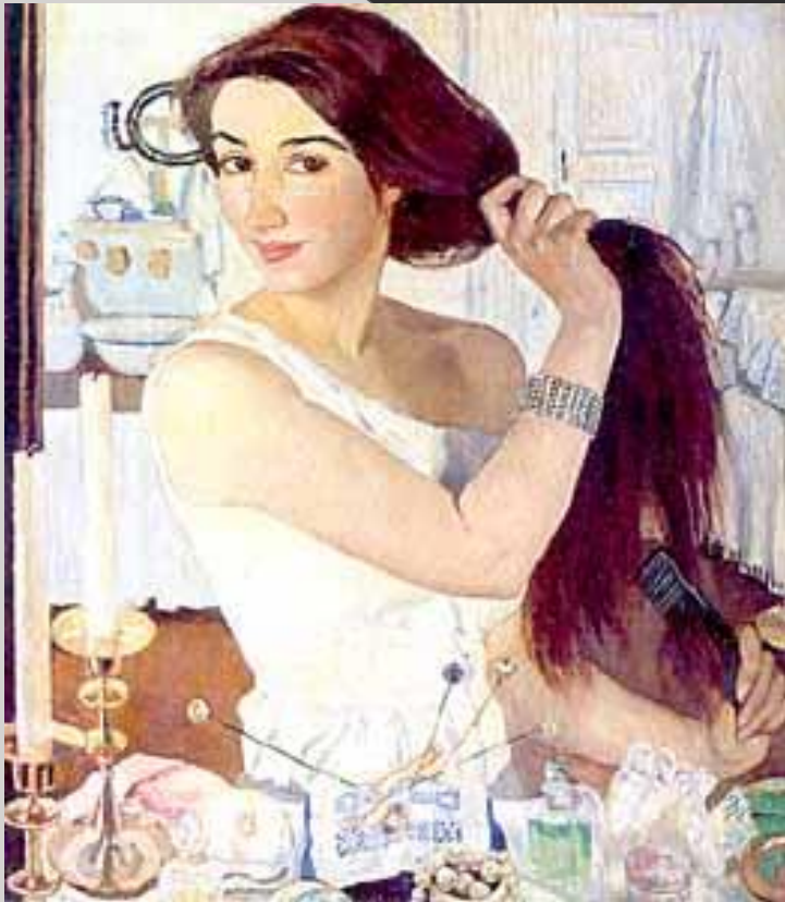
3. Серебрякова автопортрет