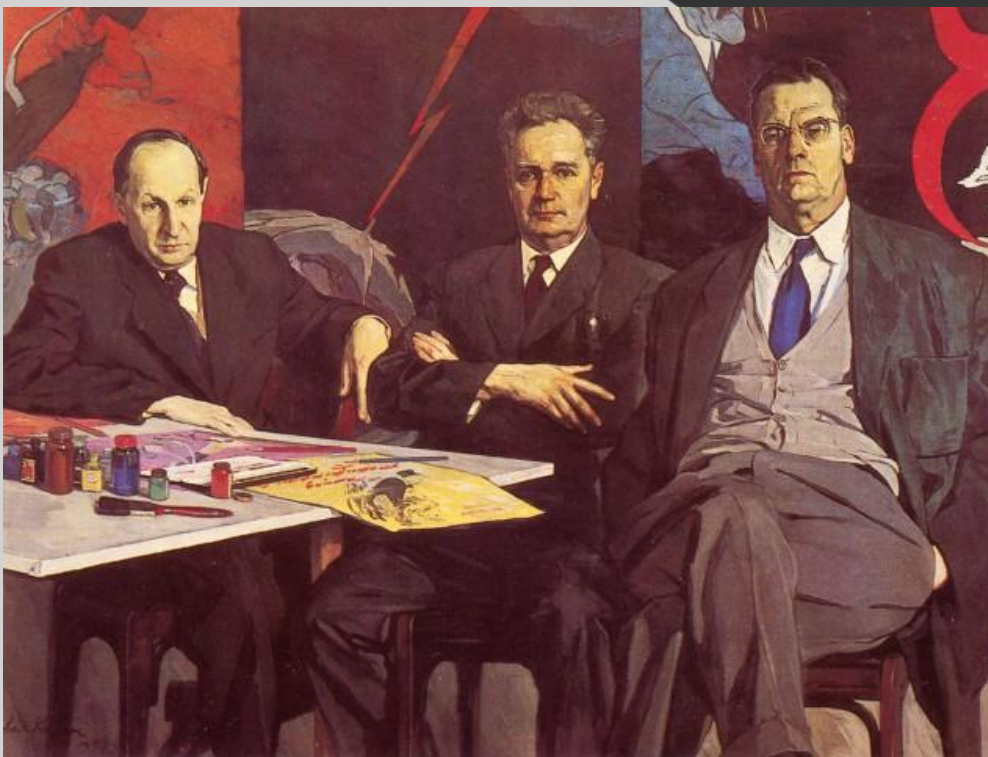
П. Д. Корин Портрет художников «Кукрыниксы»

Групповой портрет - портрет, включающий не менее трех персонажей.