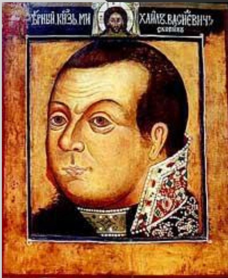
Неизвестный художник Портрет воеводы князя М. В. Скопина – Шуйского