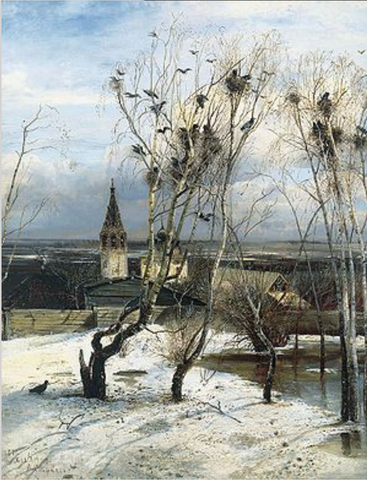
А.К. Саврасов «грачи прилетели»