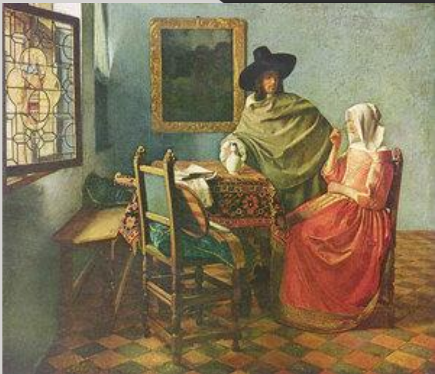
Вермер «Бокал вина»