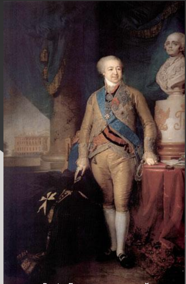
В. Л. Боровиковский Портрет вице-канцлера А. Б. Куракина