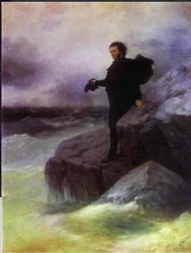
Айвазовский Н. Е. Репин