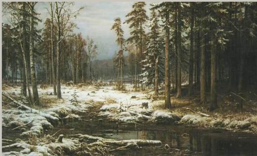
Первый снег. 1875 ШИШКИН

Французское слово «пейзаж» означает «природа». Она становится как бы «героем» произведения