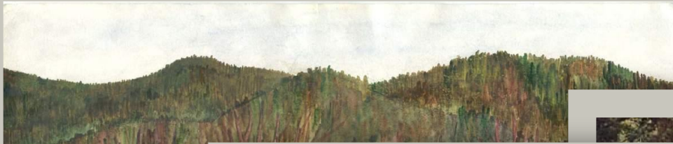
Шишкин Утро в сосновом лесу