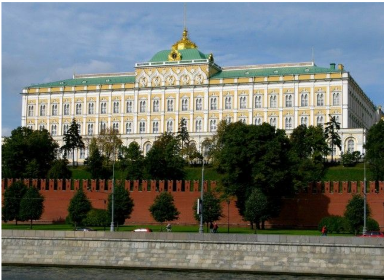
«большой Кремлевский дворец. Архитектор К.А.