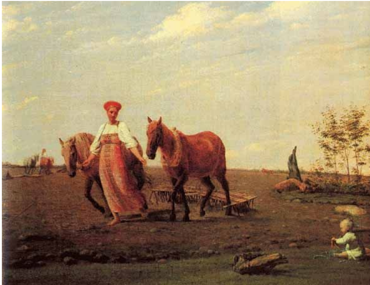
«На пашне. Весна.»