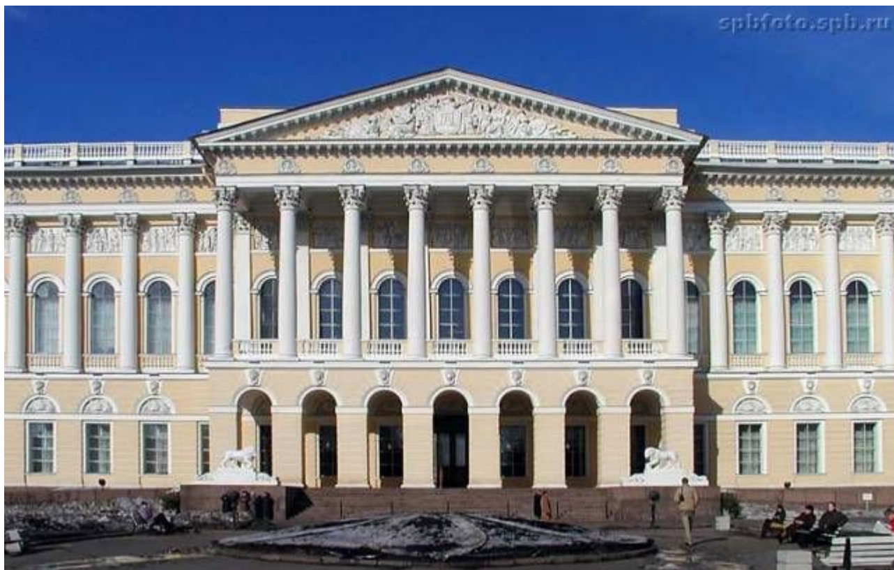
«Русский музей искусств» Карл Иванович Росси