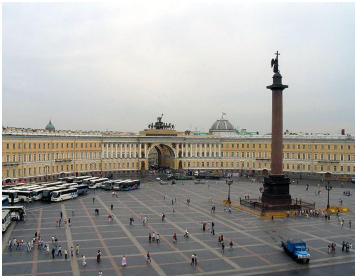
Здание Главного штаба и Александрийский столп. К.Росси и О. Монферран