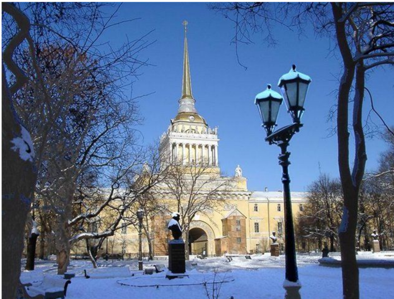
«Адмиралтейство». Андрей Дмитриевич Захаров