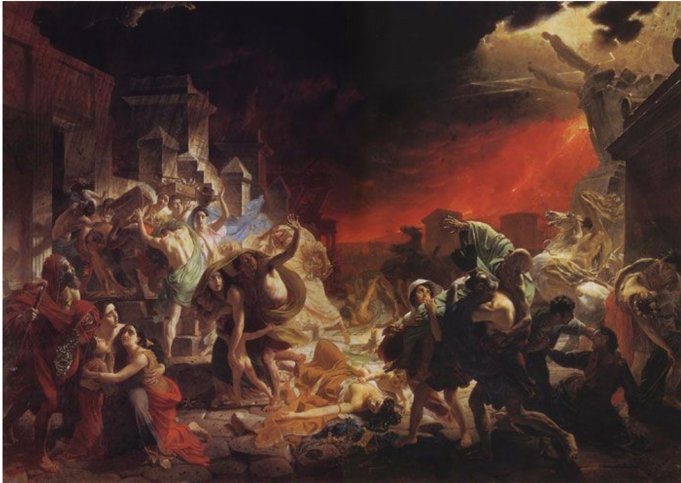
Последний день Помпеи