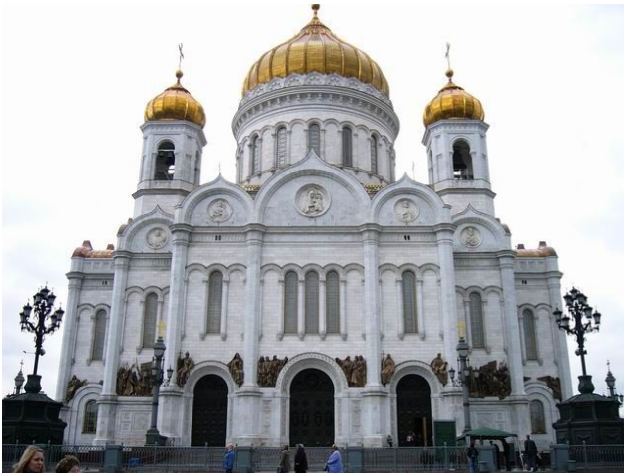
Константин Андреевич Тон. Храм Христа Спасителя. Русско-византийский стиль