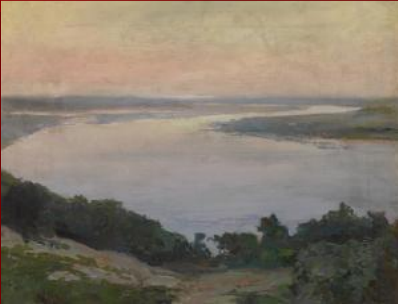
«Днепр под Киевом»

В начале XX века укрепляются связи западноукраинских художников с Левобережной Украиной. Среди тех, кто способствовал этому сближению, был видный живописец и активный художественный деятель И.И. Труш.