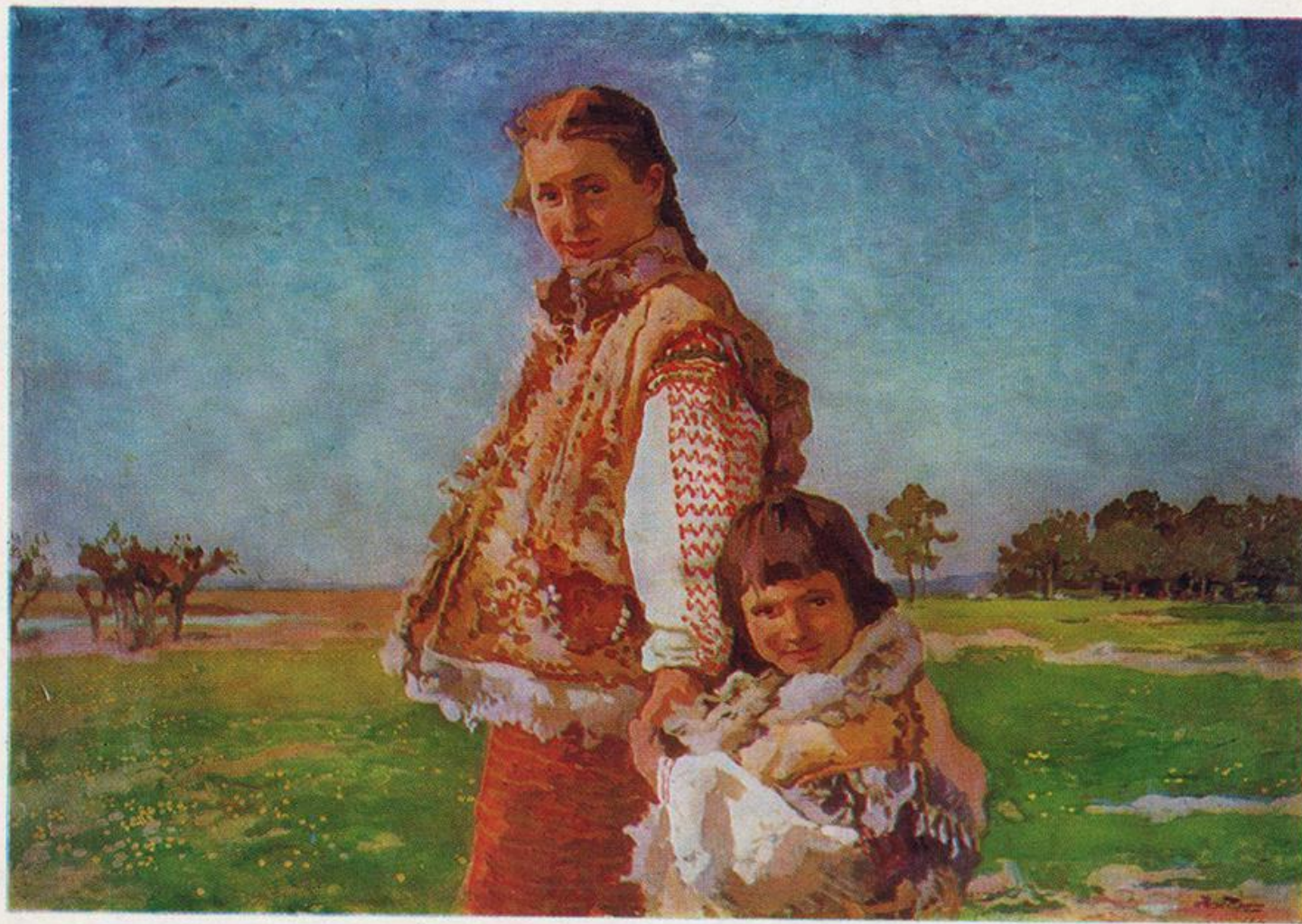
«Гуцулка с ребенком»

В жанровых картинах И. Труш многогранно воплотил своеобразный быт гуцульского села