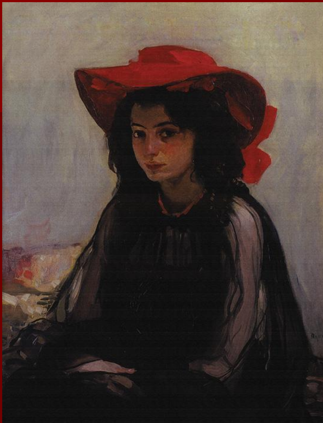
«Девушка в красной шляпе»