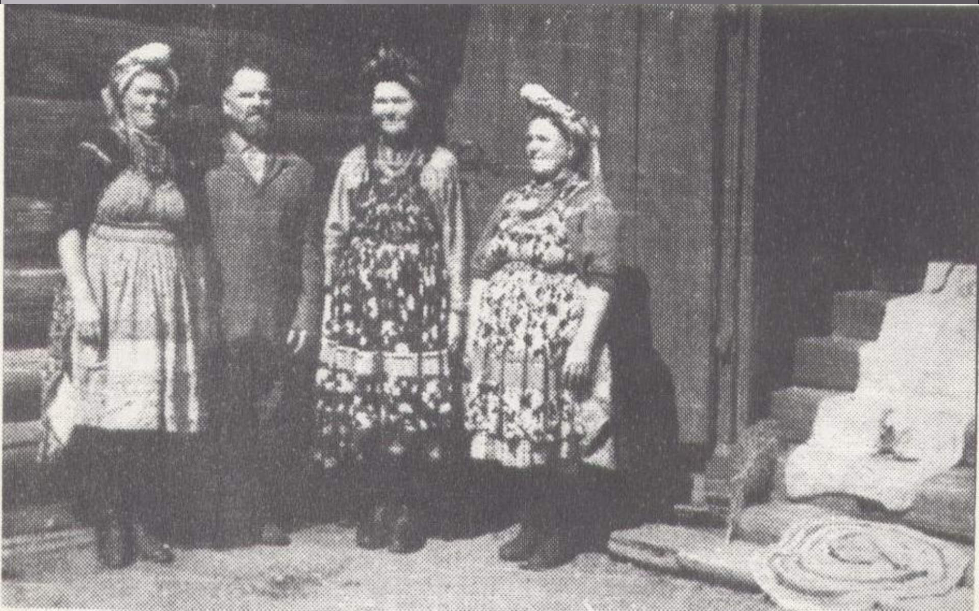
Жители села Бичура (1980 год)