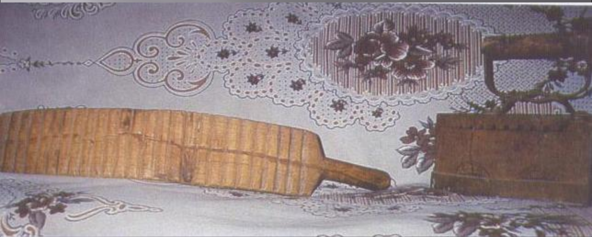
Рубель и утюг