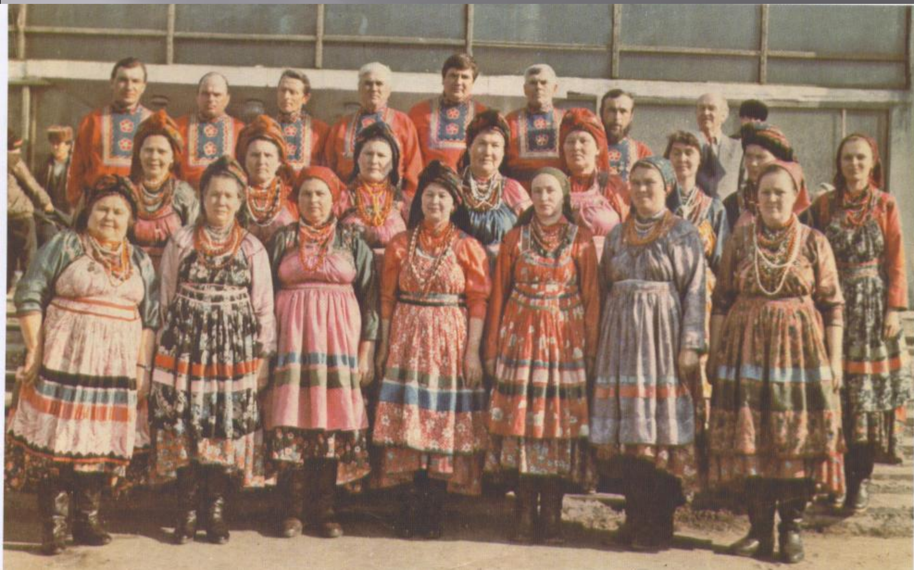
Семейный народный хор села Новосретенка Бичурского района(1988 год)