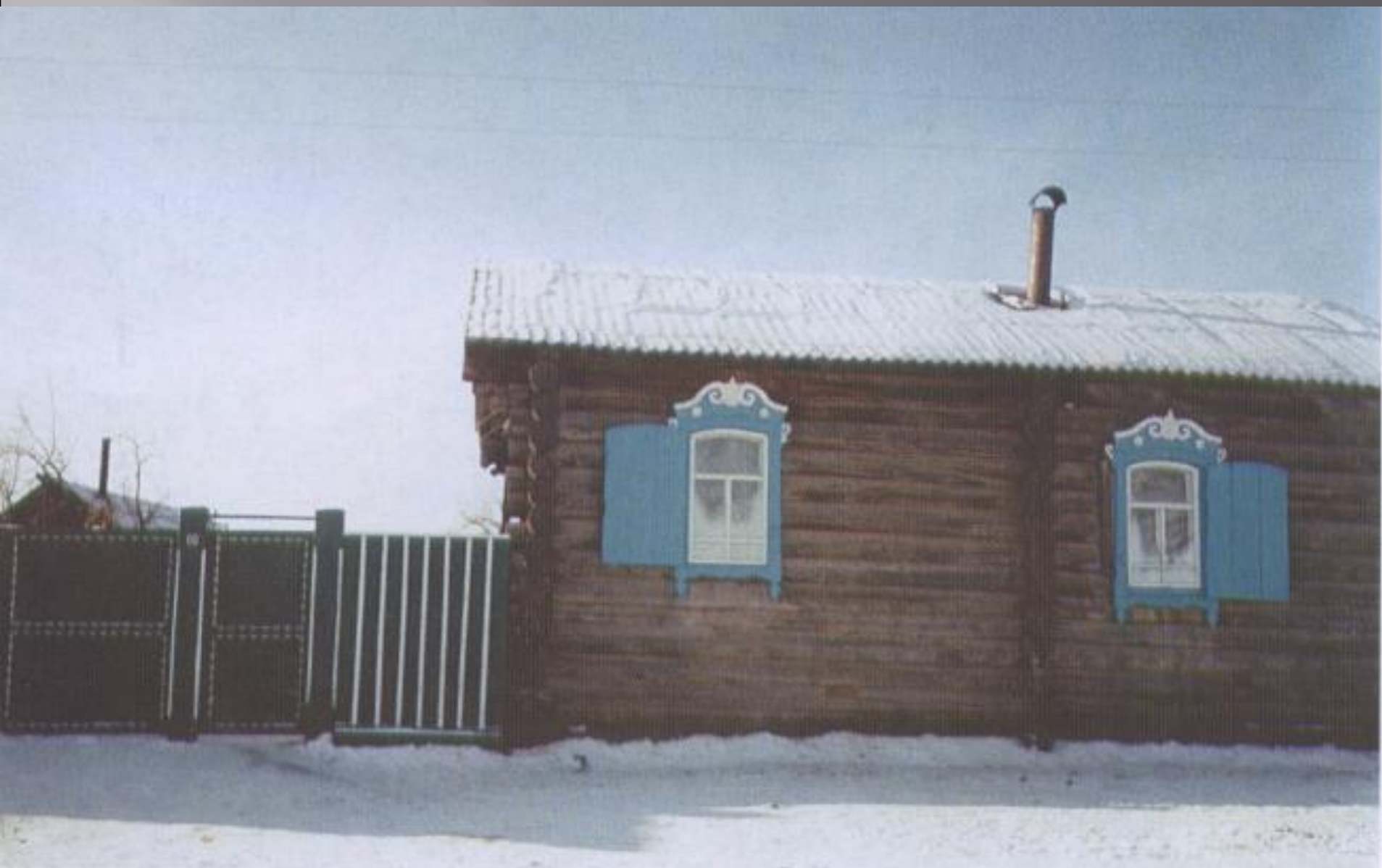
Дом в селе Новосретенка Бичурского района (построен в 1903 году)