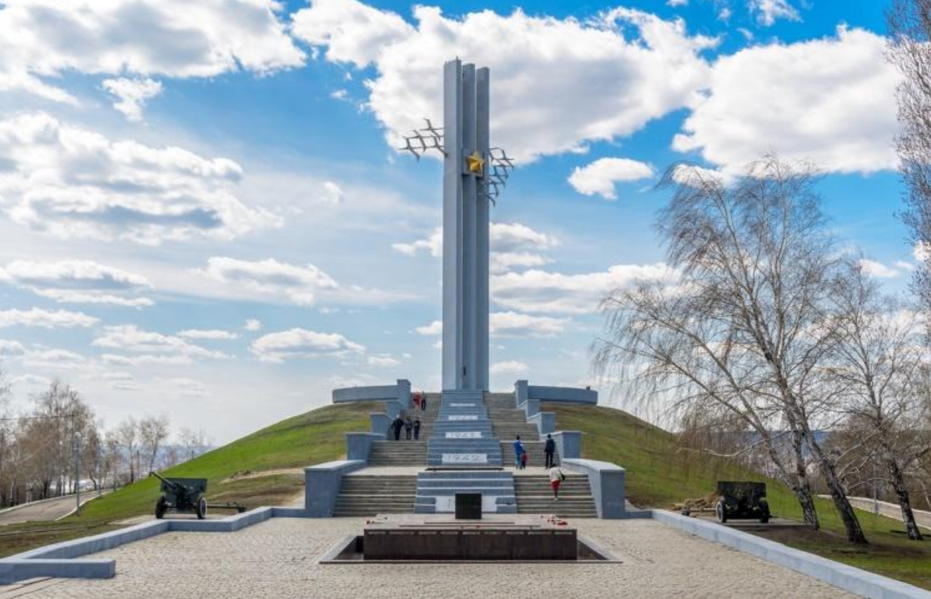
Меморіальний комплекс «Журавлі» у парку Перемоги на Соколовій горі м. Саратова - пам'ятник саратовцям, загиблим у Великій Вітчизняній війні 1941-1945 рр.