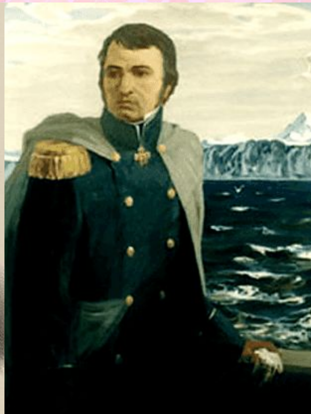
И. Ф. Крузенштерн