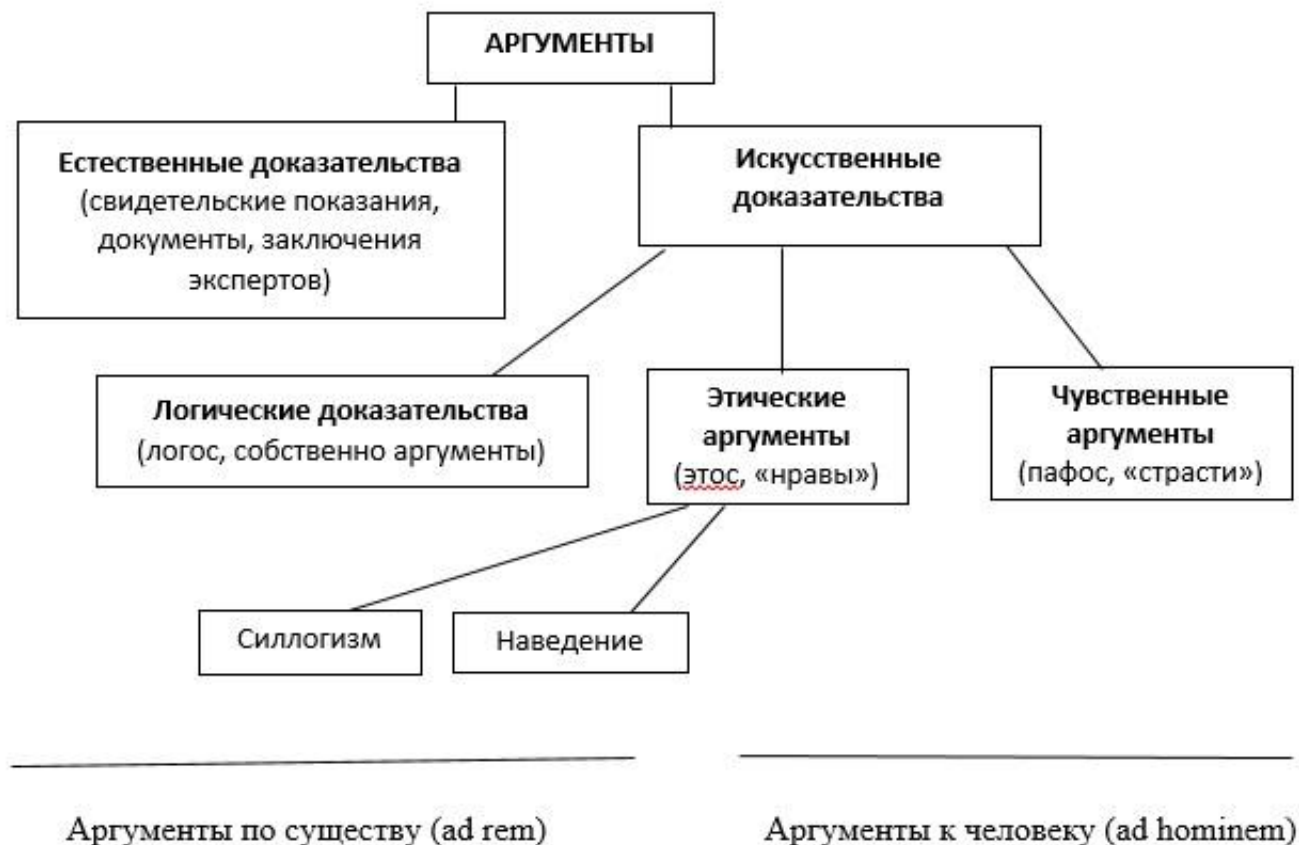
Рисунок 2. Виды аргументов

Это самые общие основания для классификации, более подробно виды аргументов описываются ниже. Пока же отошлем читателя к рисунку 2, на котором представлена классификация аргументов.