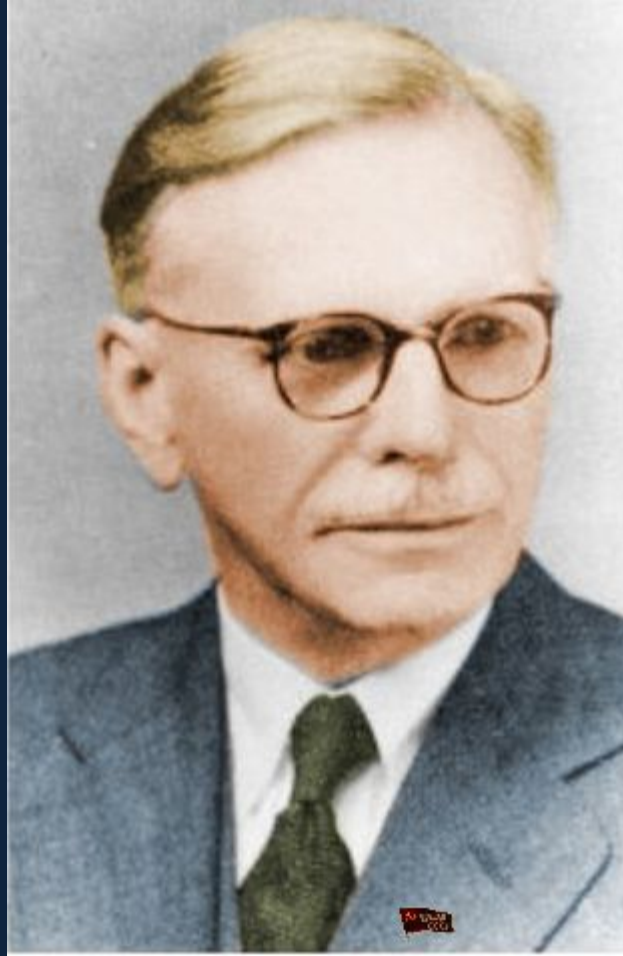
Джон Руперт Ферт (1890 – 1960)

Английский лингвист, специалист по общему языкознанию и фонологии, структурной лингвистике, функциональной стилистике, индологии, а также основоположник Лондонской лингвистической школы