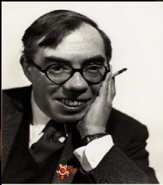
Уолтер Эрнест Аллен (1911 – 1995)