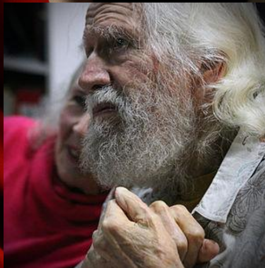
Фрэнк Роберт (1902 (марстоящее время)