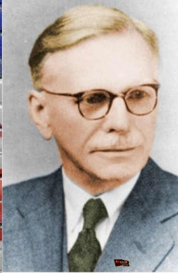
Джон Руперт Ферт (1890 – 1960)