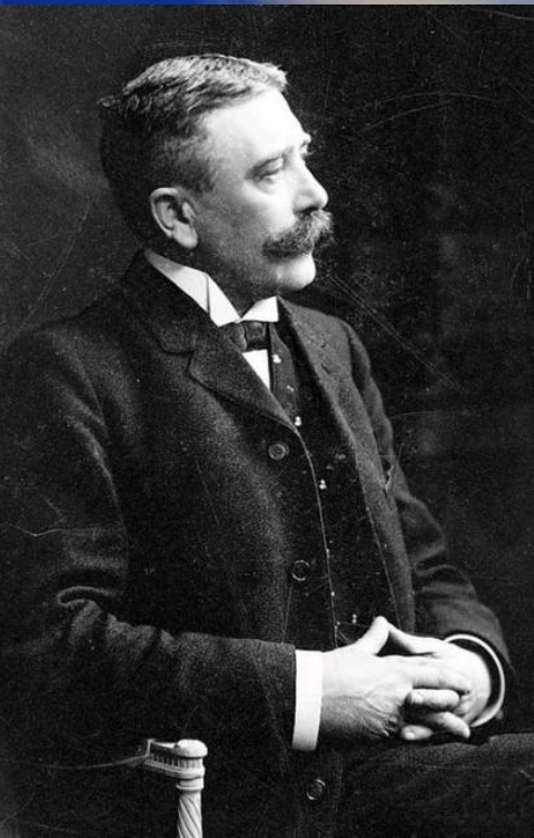
Фердинанд де Соссюр (1857 – 1913)