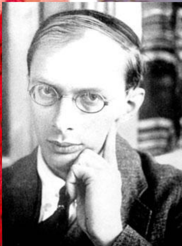
Бронислав Каспер Малиновский (1884—1942)