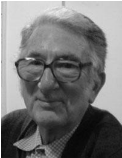
Michael A. Kirkwood Halliday

Michael A. Kirkwood Halliday (1925 – наст.вр.)