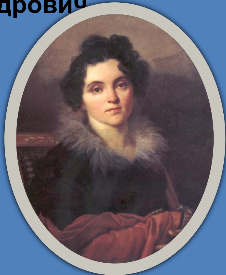
Наталья Дмитриевна Фонвизина