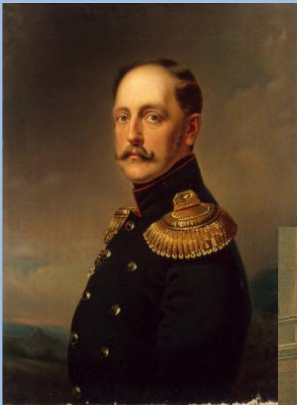
Русский император Николай I