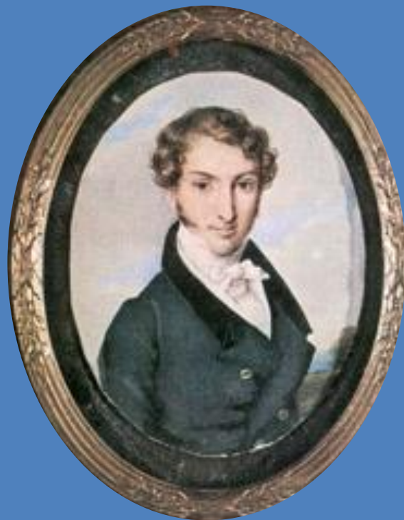
Трубецкой Сергей Петрович