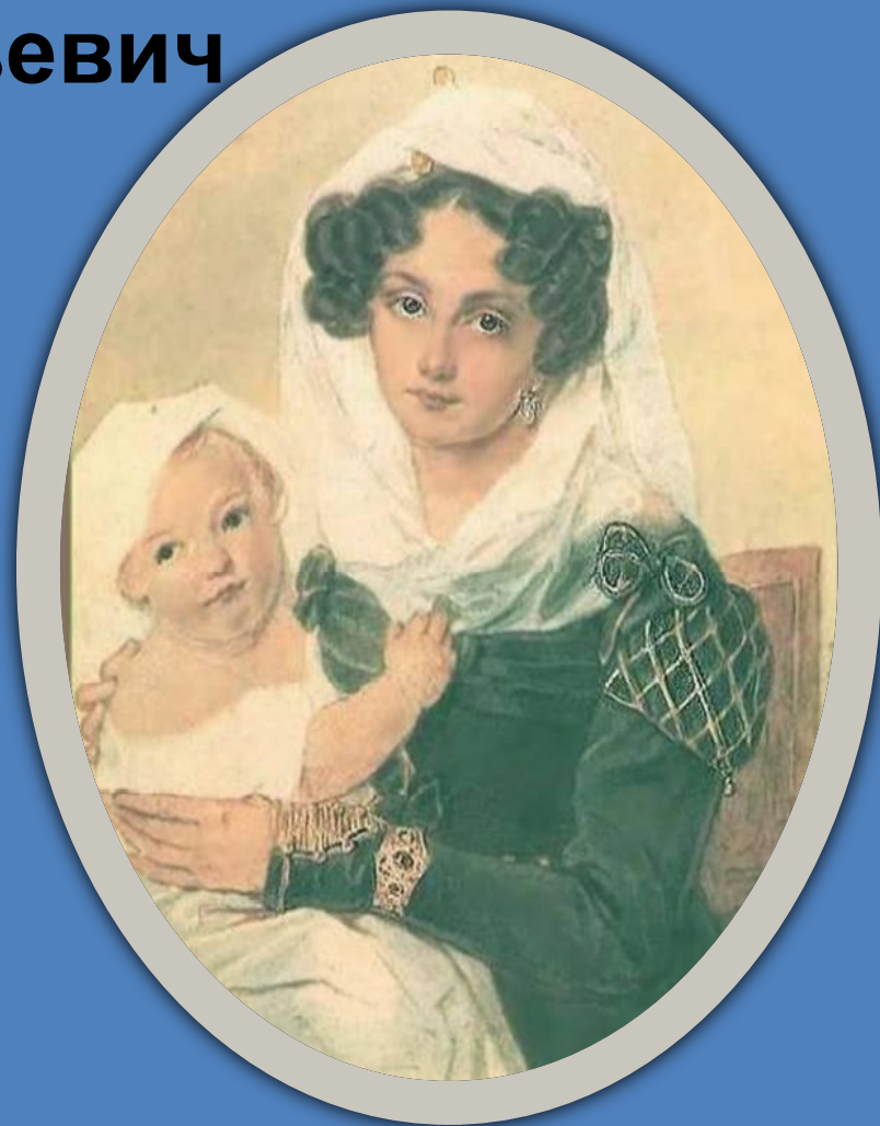
Мария Николаевна Волконская