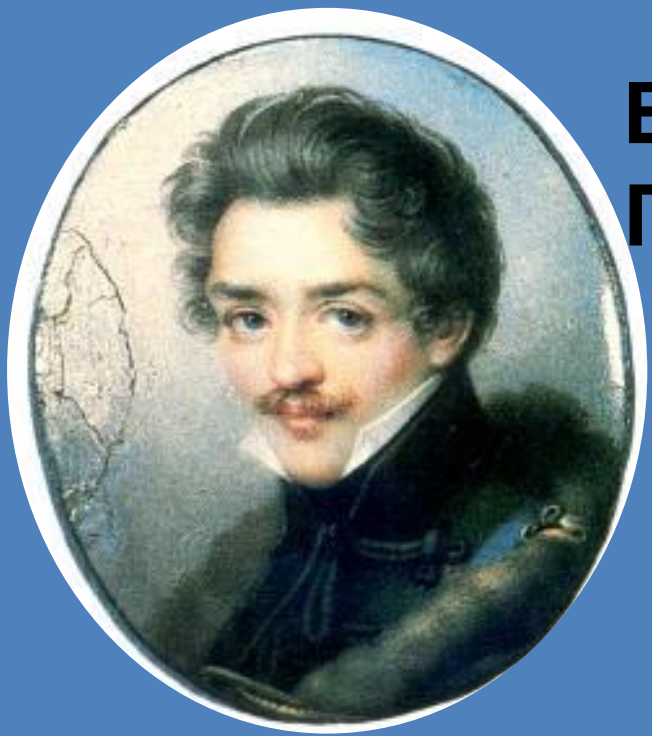
Волконский Сергей Григорьевич