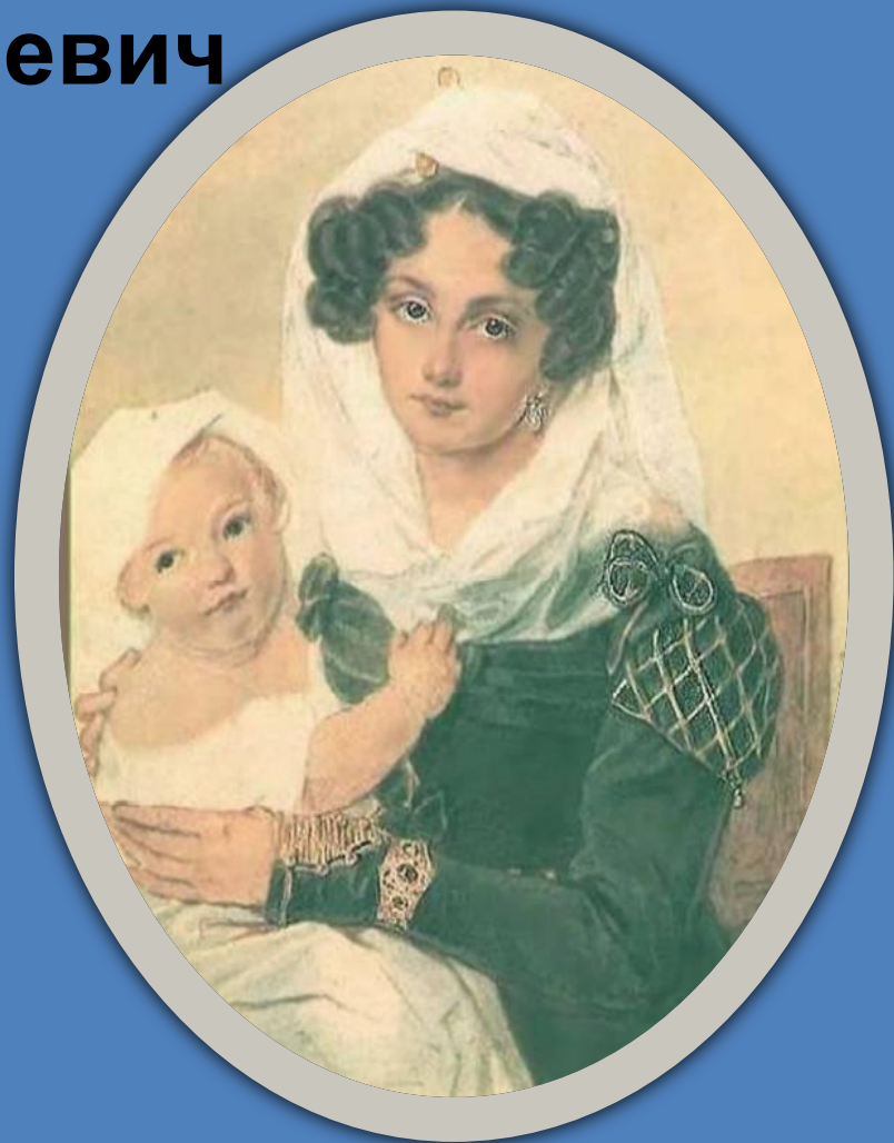
Мария Николаевна Волконская