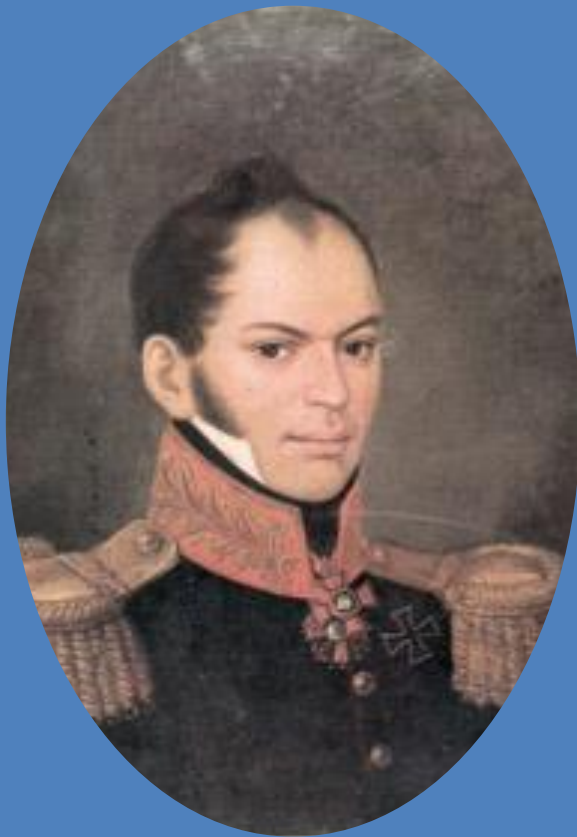
Фонвизин Михаил Александрович