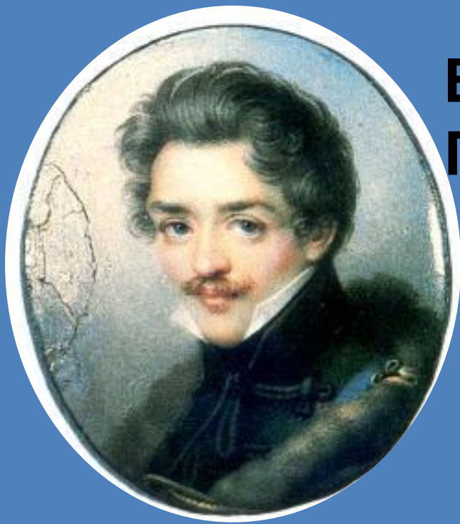
Волконский Сергей Григорьевич