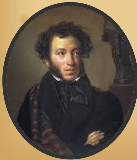
А. С. Пушкин