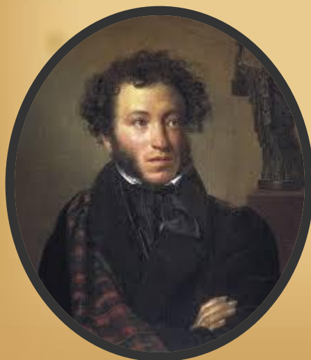
А. С. Пушкин