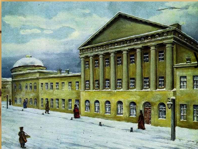
Московский университетский благородный пансион