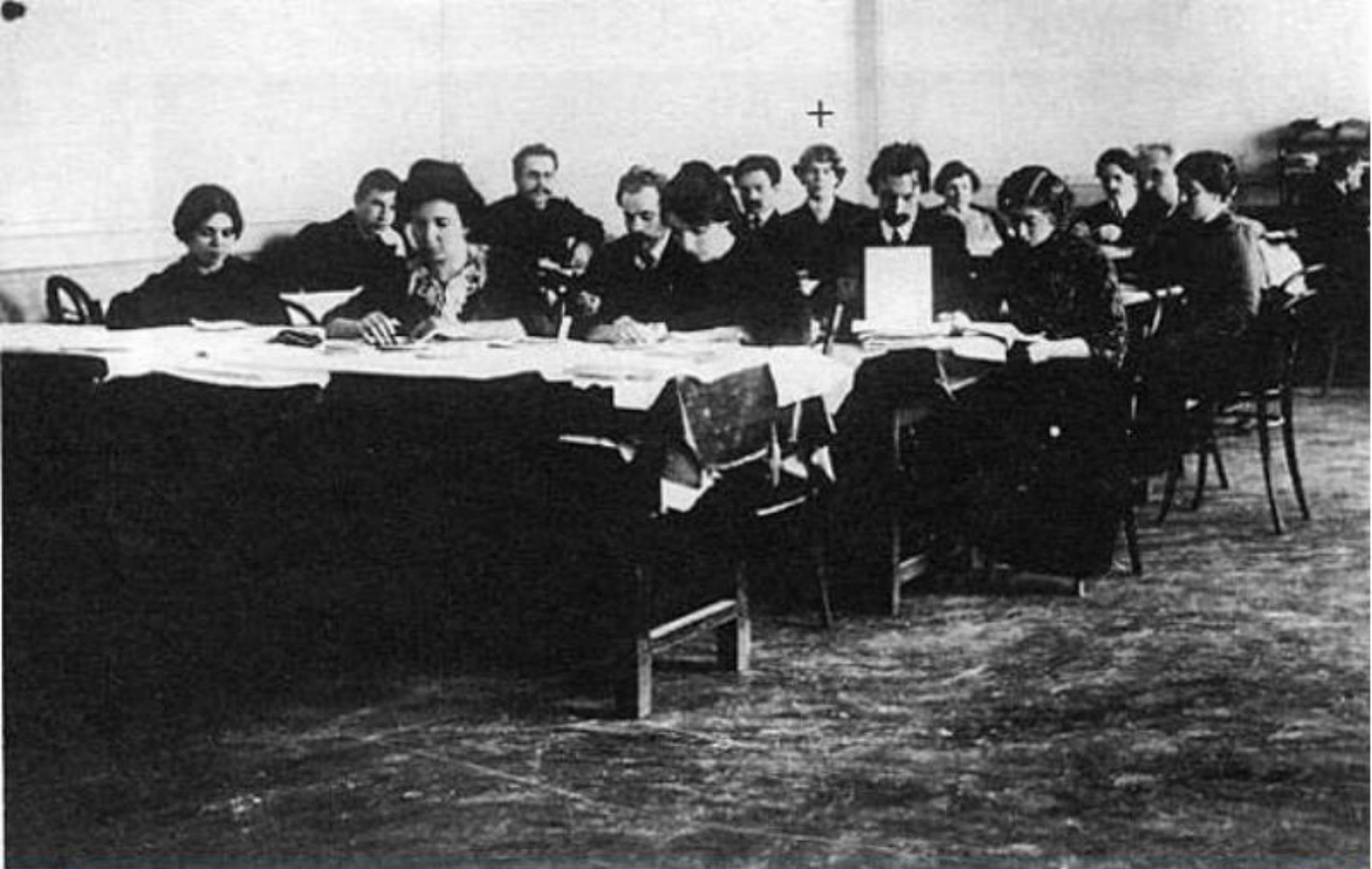
С. А. Есенин (отмечен крестиком) на занятиях кружка самообразования работников типографии «Т-во И. Д. Сытина». 1914 г., Москва.