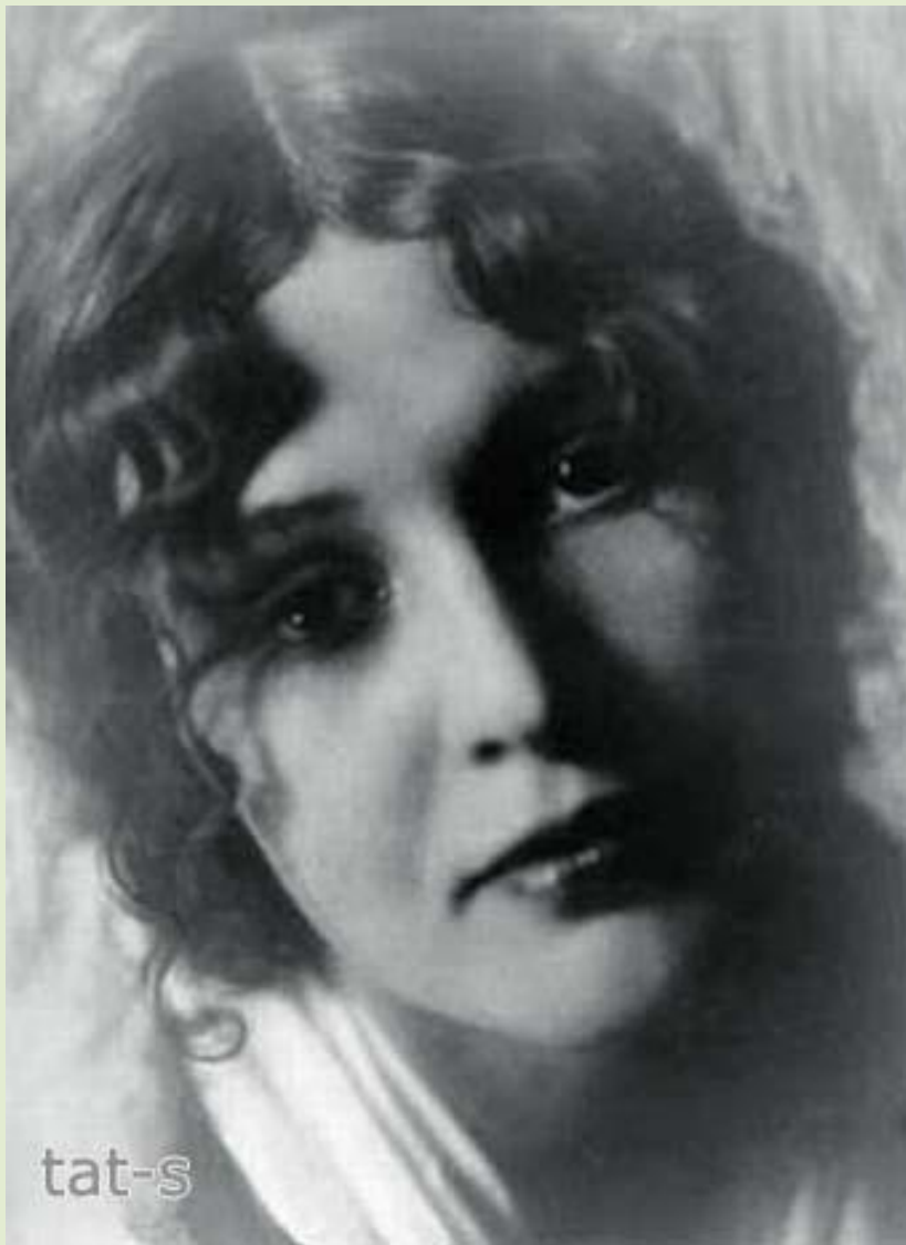
Жена Есенина, актриса - Зинаида Николаевна Райх (1894 - 1939)

30 июля 1917 года Есенин (21 год) обвенчался актрисой Зинаидой Райх