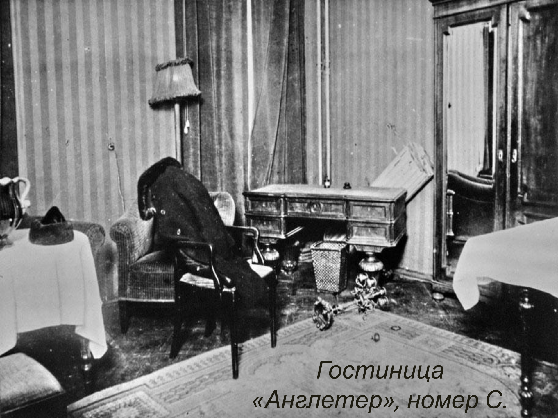
Гостиница «Англетер», номер С.