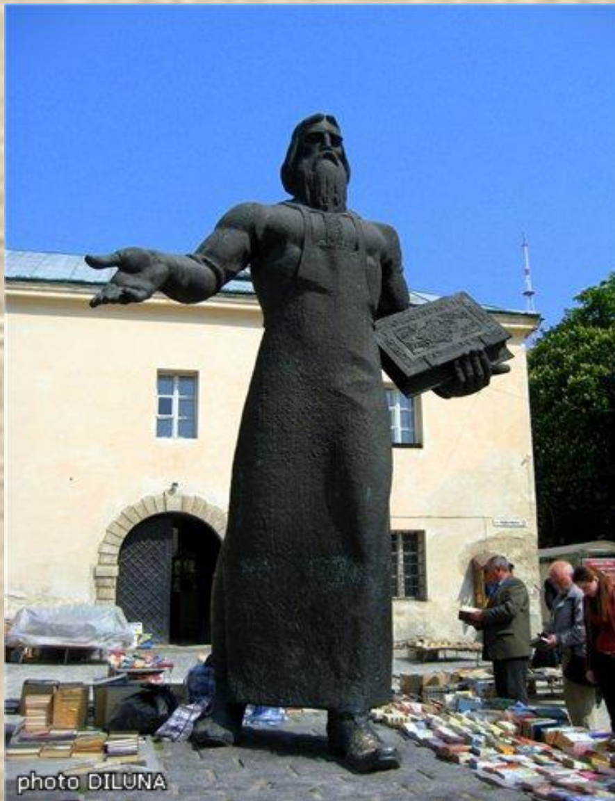
Памятник Ивану Фёдорову.