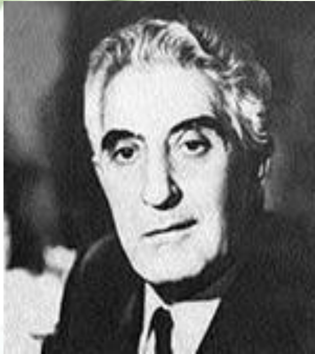
Овсей Овсеевич Дриз (1908 – 1971)