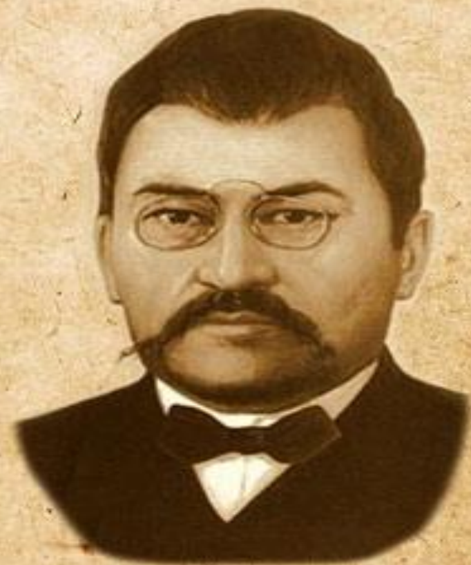
АХМЕТ БАЙТҰРСЫНОВ (1873-1938)