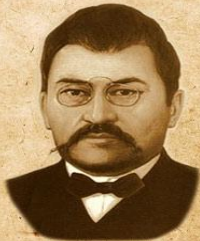
АХМЕТ БАЙТҰРСЫНОВ (1873-1938)