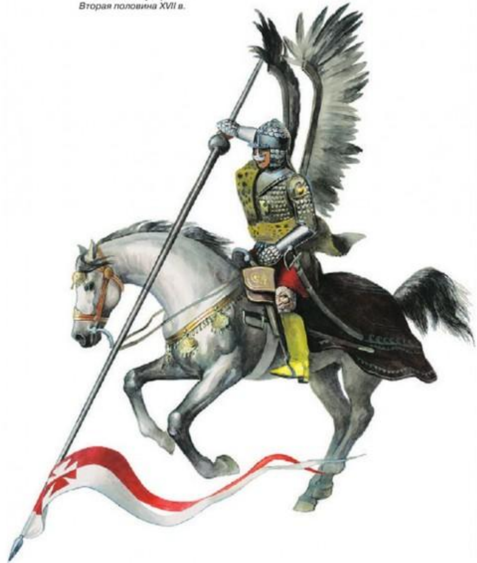
Польский гусар. Вторая половина XVII в.

Кольчужники и латники – Воины, одетые в кольчуги и латы