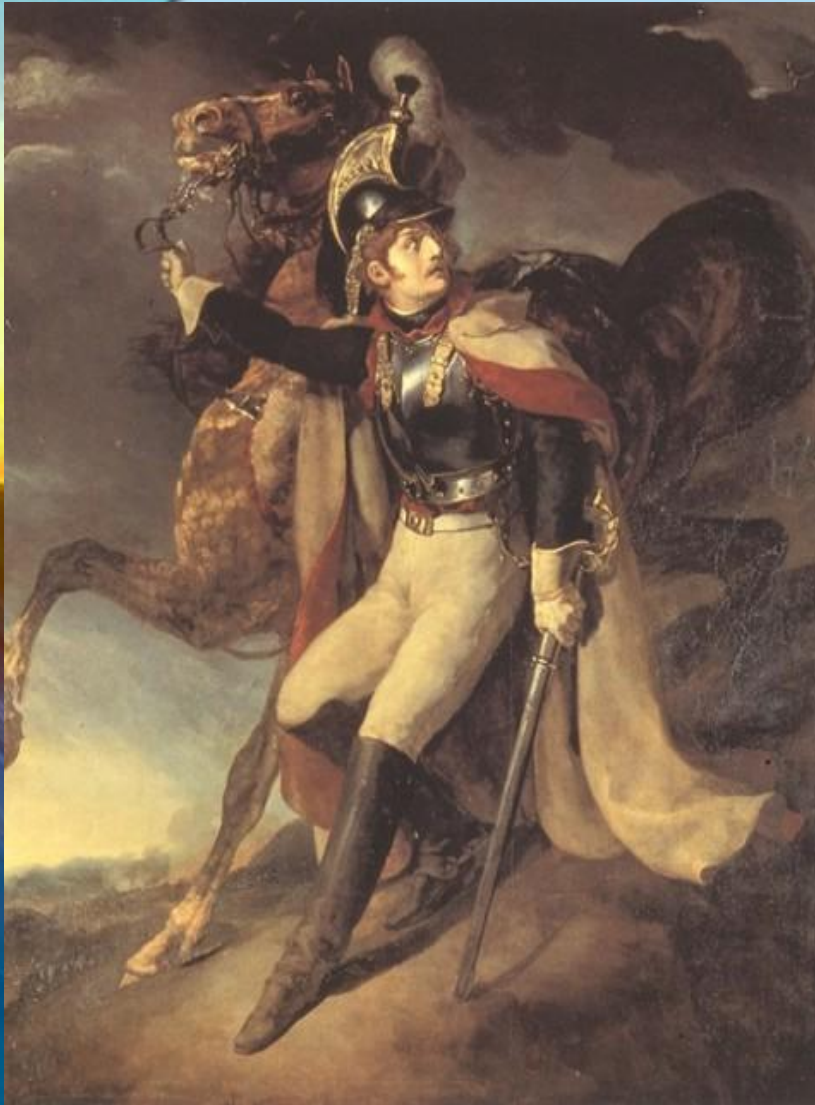
Т.Жеріко “Ранений кірасир”