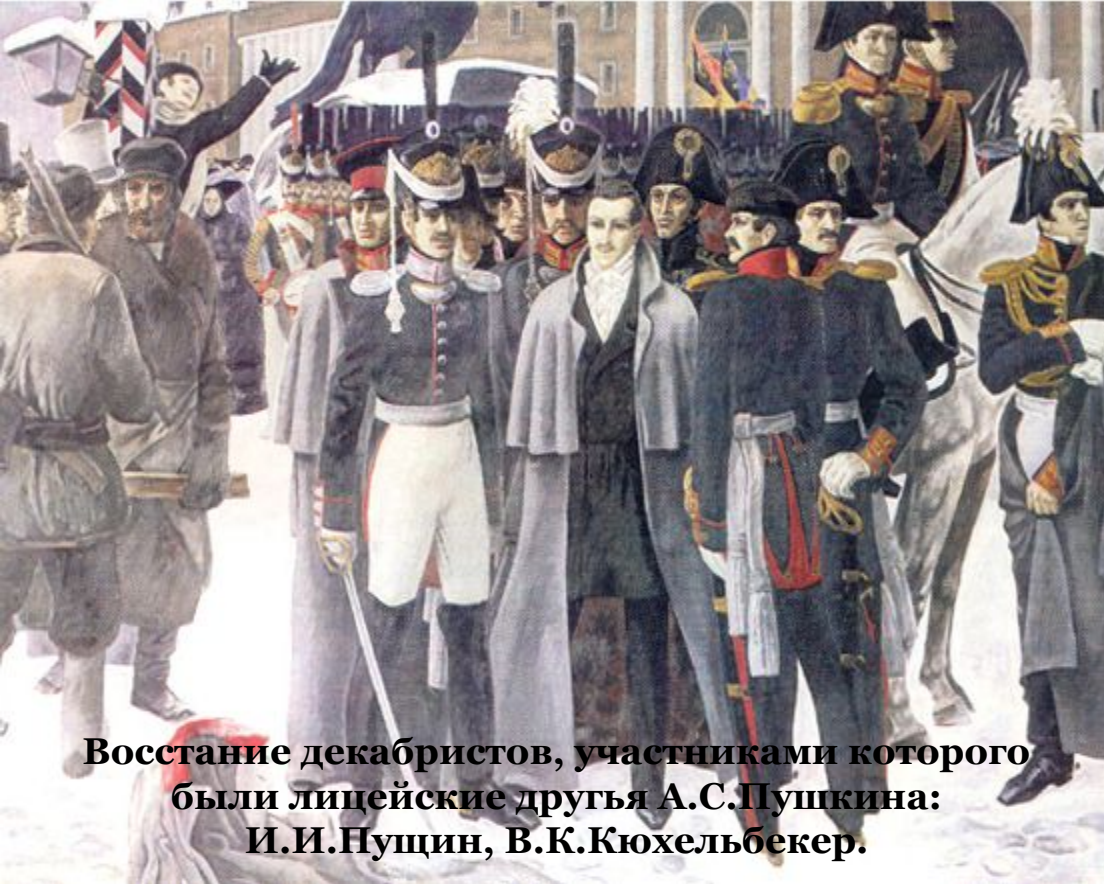
Восстание декабристов, участниками которого были лицейские друзья А.С.Пушкина: И.И.Пушин, В.К.Кюхельбекер.