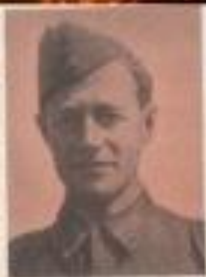
А. В. Сурков. Фото военного 1941