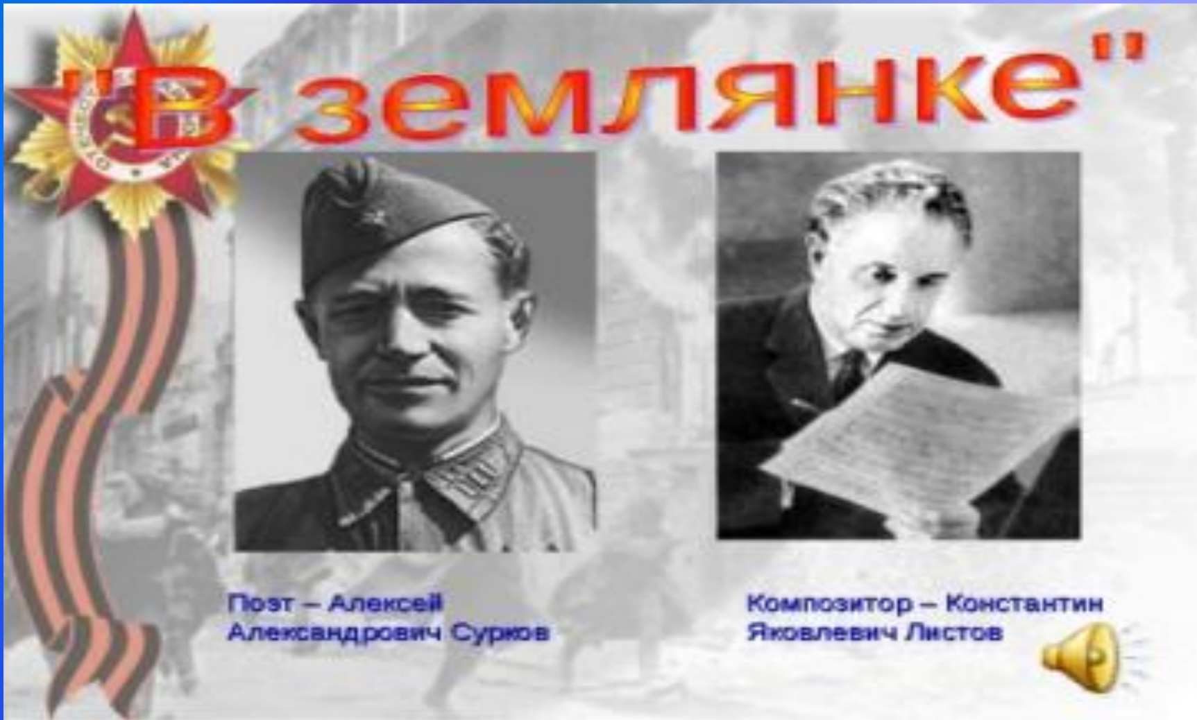
Поэт – Алексей Александрович Сурков