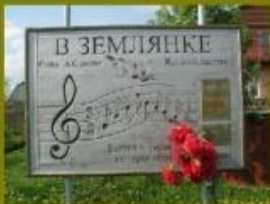
Памятник фронтовой песне - «В землянке» в деревне Кашино