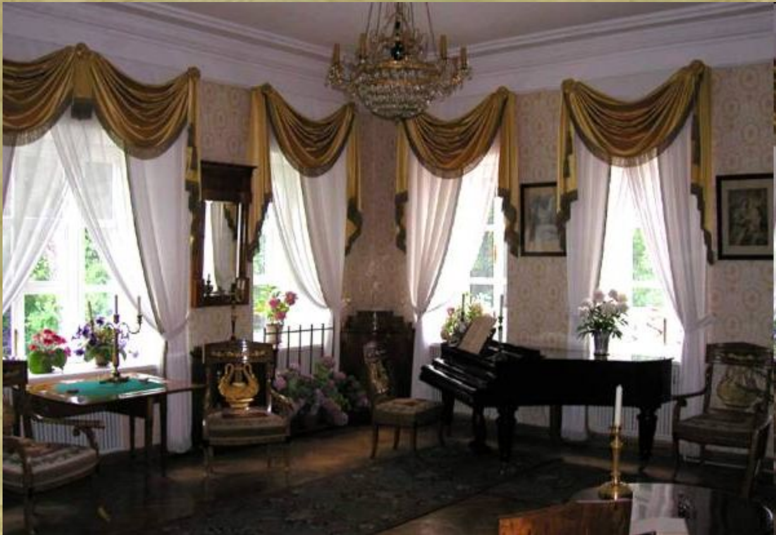
В барском доме. Зала, обставленная роскошной мебелью к.18 – н.19 века.