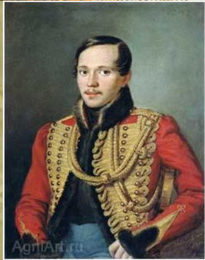
Заболоцкий П.Е. Портрет поэта М. Ю. Лермонтова. 1837. Из коллекции Третьяковской галереи