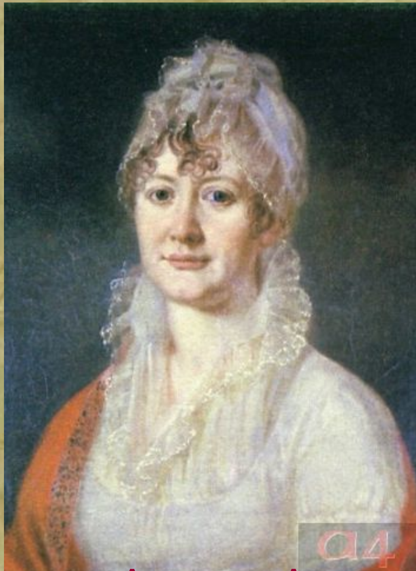
Елизавета Алексеевна Арсеньева, бабушка поэта. Неизвестный художник. Начало XIX века