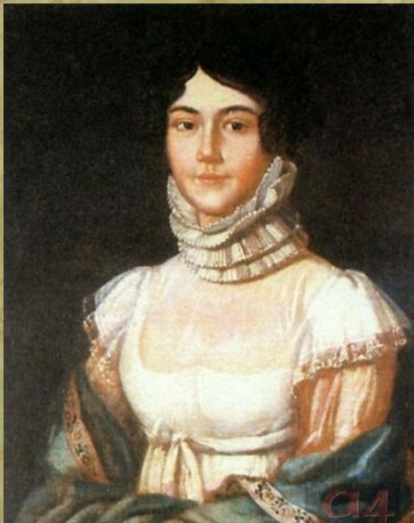
Мария Михайловна Лермонтова, мать поэта. Неизвестный художник. 1810