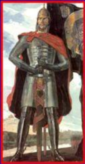
Князь Александр Невский