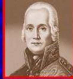
Адмирал Фёдор Ушаков