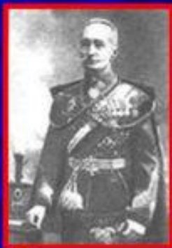
Генерал Алексей Брусилов