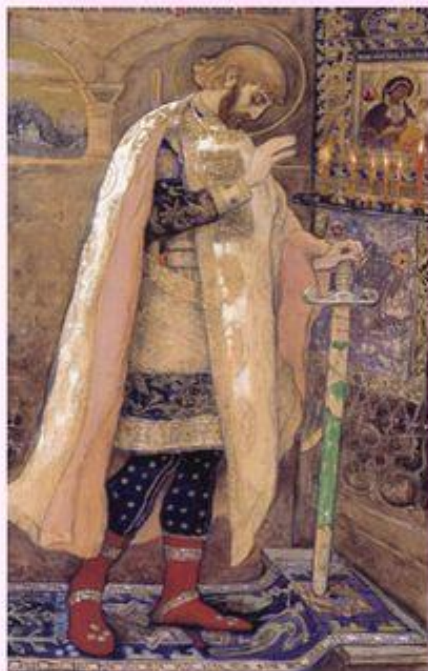
Святой князь Александр Ярославович

«... и ростом он был выше других, и голос его – как труба в народе, лицо же его – как лицо Иосифа, которого поставил египетский царь вторым после себя человеком в Египте. Сила же его была частью силы Самсона. И дал Бог ему премудрость Соломона, а храбрость его – как у царя римского Веспасиана, который пленил всю землю