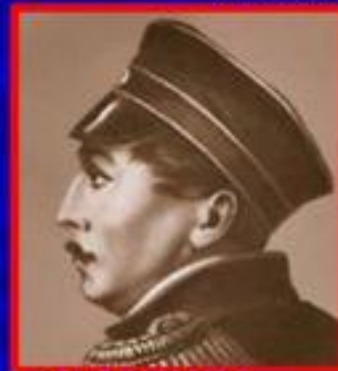
Адмирал Павел Нахимов