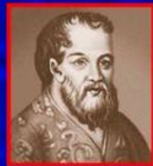
Князь Дмитрий Пожарский