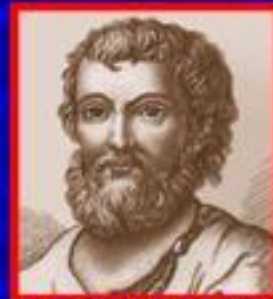
Гражданин Кузьма Минин