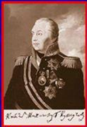
Фельдмаршал Михаил Кутузов