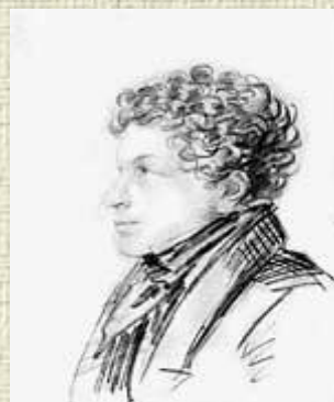
Брат, Лев Сергеевич Пушкин (1805-1852г.)