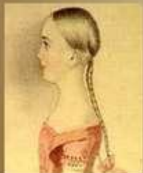
Старшая дочь Мария Александровна Пушкина (1832-1919г.)