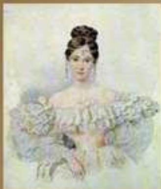
Натали Гончарова жена А. С. Пушкина. и мать его 4 детей