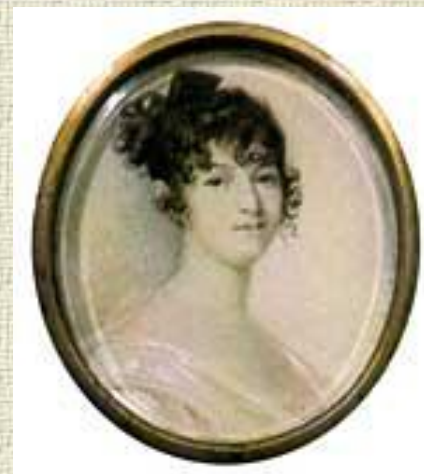
Мать, Надежда Осиповна Пушкина (1775-1836г.)