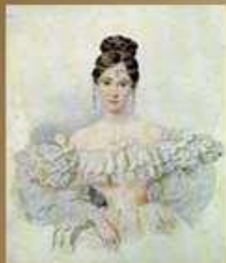
Натали Гончарова жена А. С. Пушкина. и мать его 4 детей