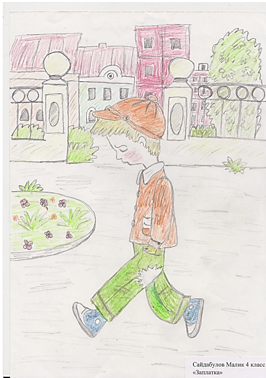
Сайдабулов Малик 4 класс «Заплатка»