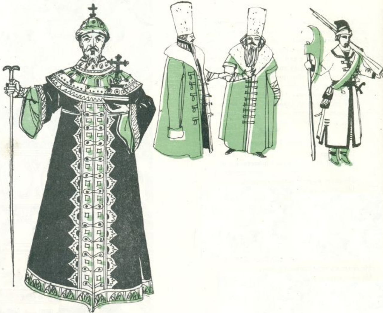
Одежда 16 век