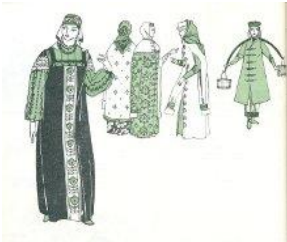
Одежда 16 век