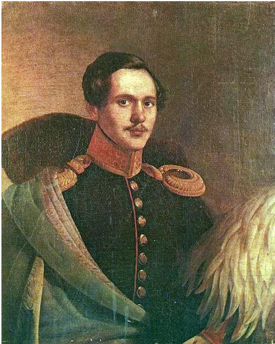
Михаил Юрьевич Лермонто в 1814-1841