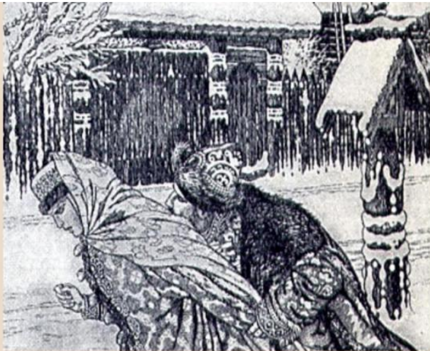
«Песня про купца Калашникова». Кирибеевич и Алена Дмитриевна. Художник И. Емилибин. 1938