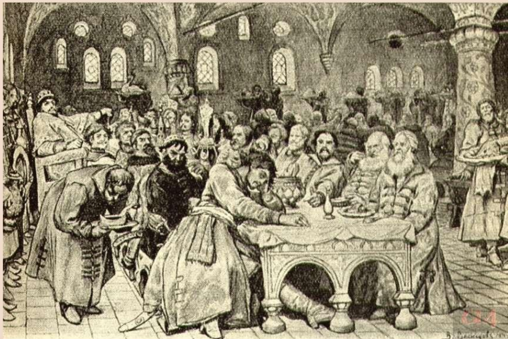
«Песня про купца Калашникова». Пир Ивана Грозного. Художник В. Васнецов. 1891