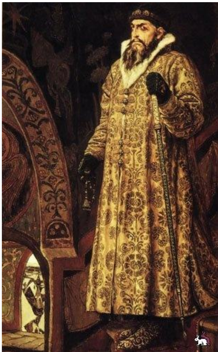
Иван 4 Грозный 1530-1584