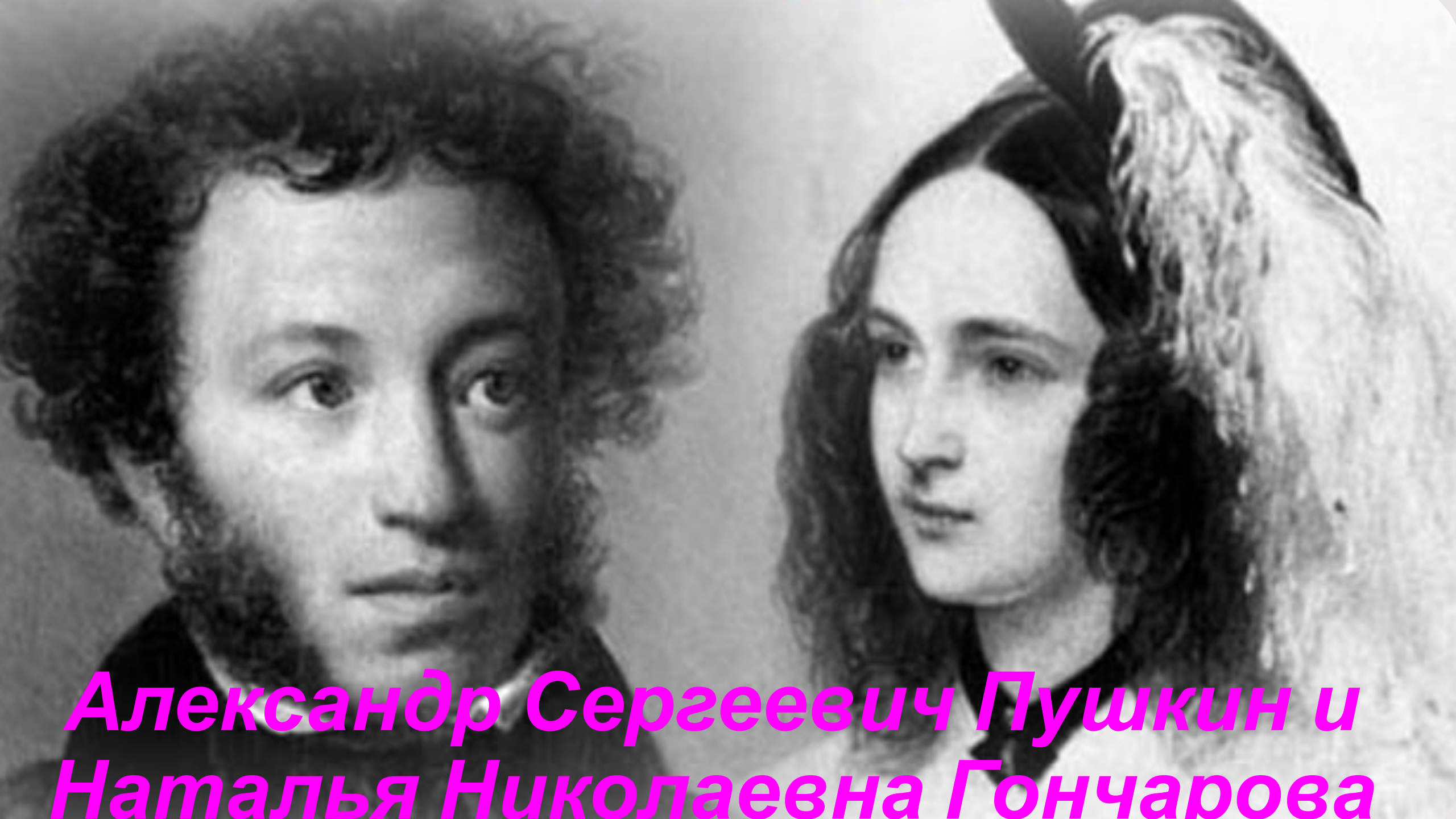
Александр Сергеевич Пушкин и Наталья Николаевна Гончарова