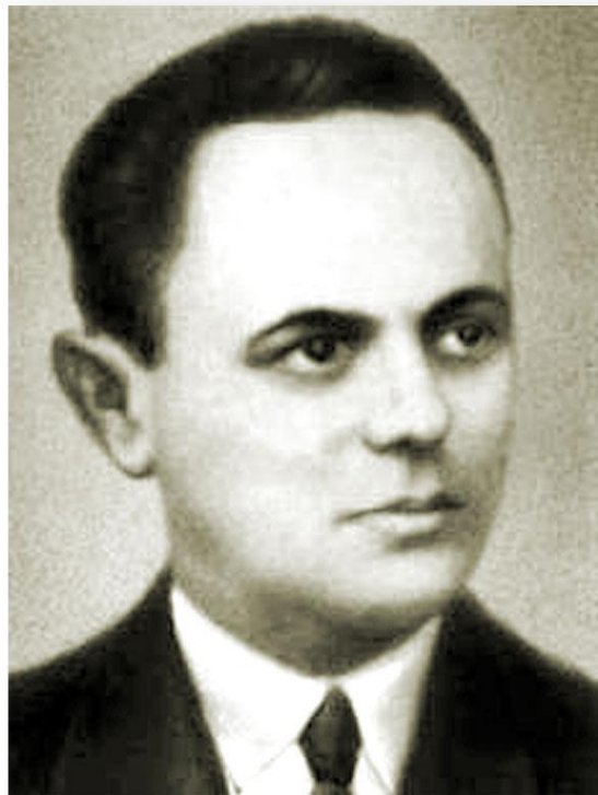
Аминад Петрович (Аминодав Пейсахович) Шполянский) (1888-1957)