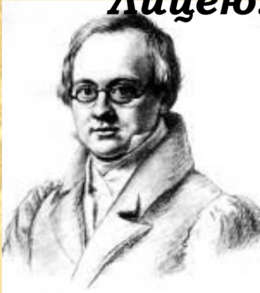
Антон Антонович Дельвиг