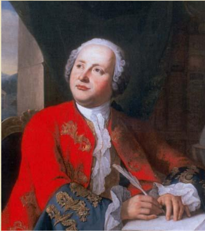
М.В. Ломоносов (1711–1765 гг.)

Его классификацию в русской литературе представил Михаил Васильевич Ломоносов, гениальный учёный во всех областях науки.