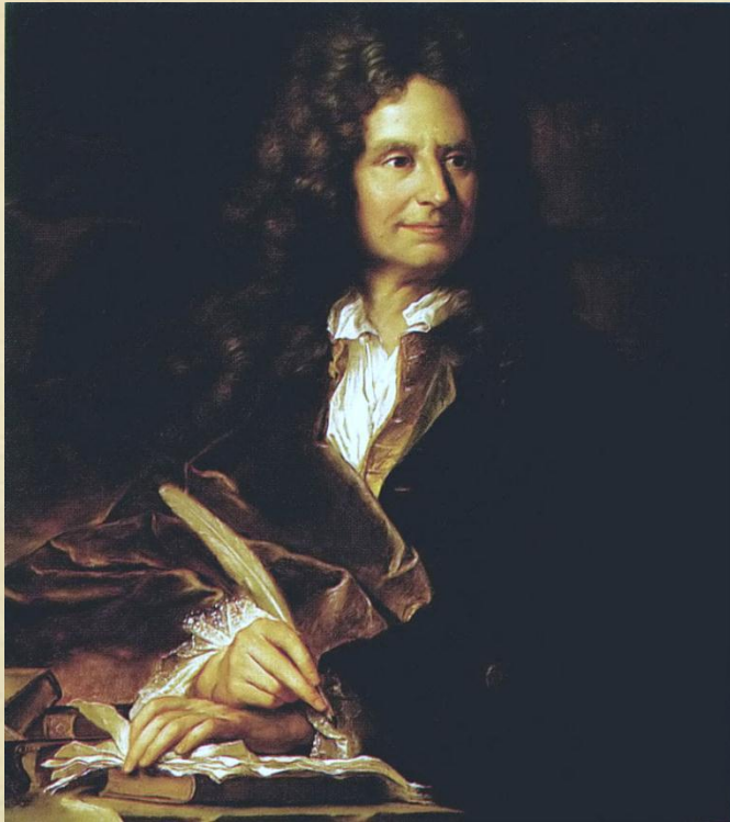
Никола Буало (1636–1711 гг.)

В литературе теоретиком классицизма считается Никола Буало, французский поэт, критик XVIII века, который в своём трактате изложил принципы классицизма.