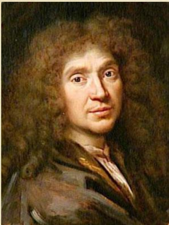
Жан-Батист Поклен (Мольер) (1711–1765 гг.)

Великим автором комедии классицизма считается Жан-Батист Поклен (Мольер), который является создателем национального французского театра.