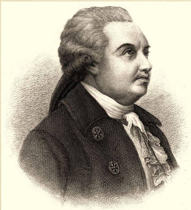
Д.И. Фонвизин (1745–1792 гг.)