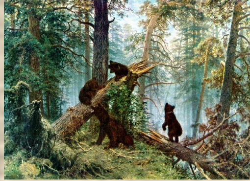
Утро в сосновом лесу.