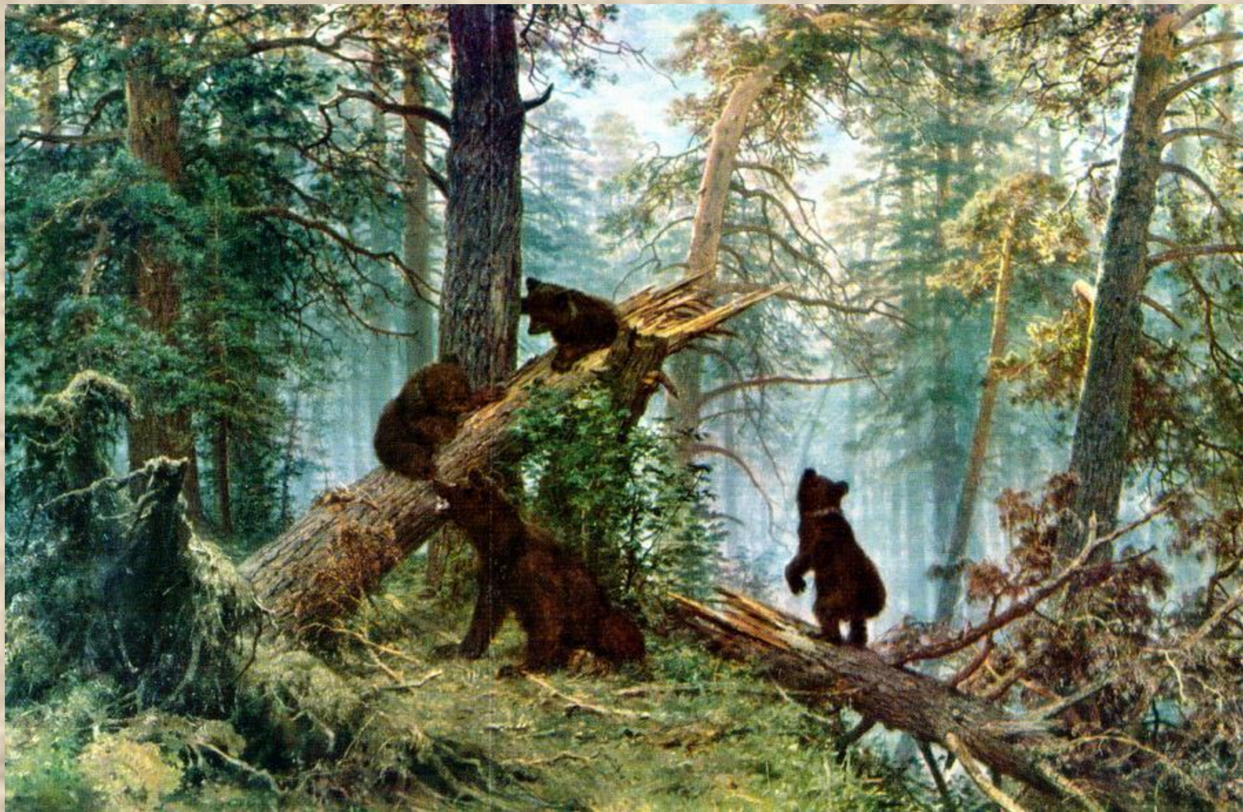
Утро в сосновом лесу