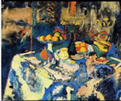
Натюрморт. Вода, бутылка, фрукты.