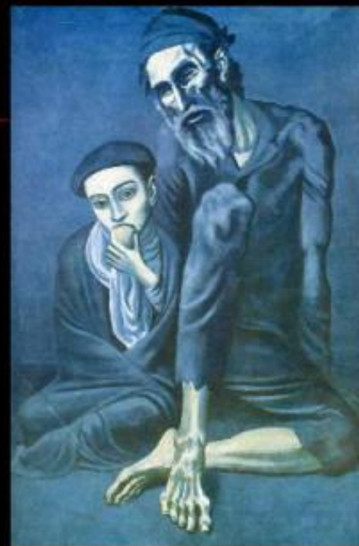
Старик-нищий с мальчиком