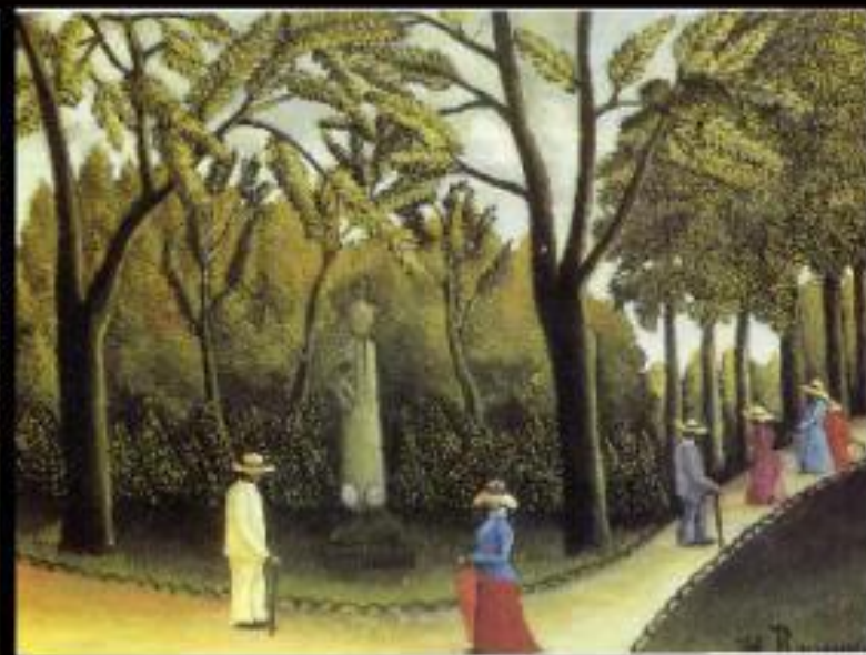
Сад. Памятник Шопену