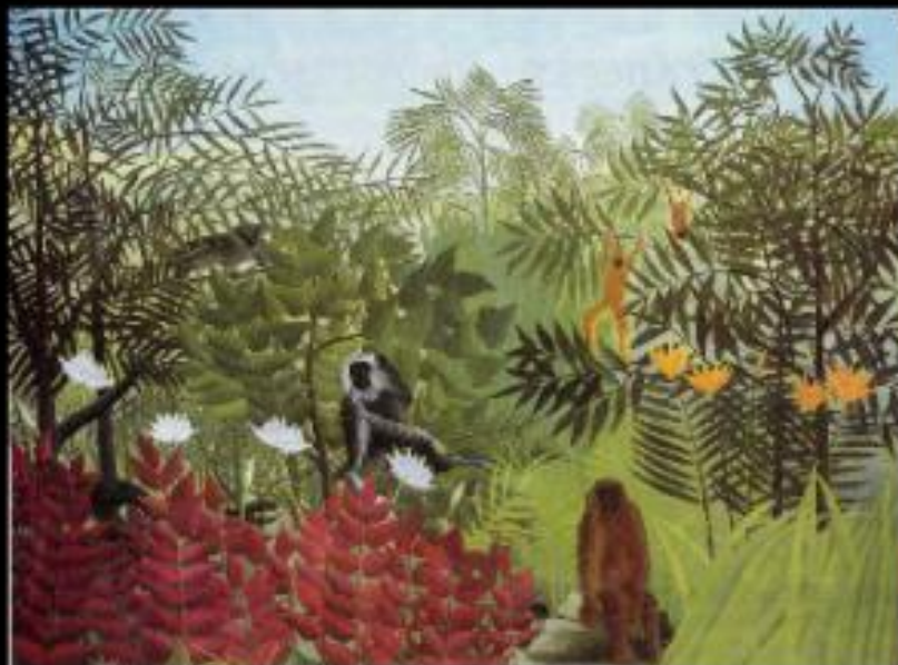
Обезьяна в тропическом лесу