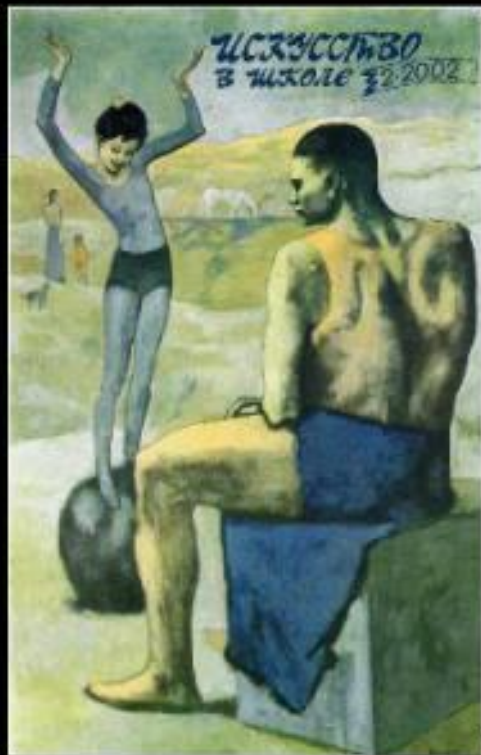
Девочка на шаре