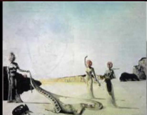
Три юные сюрреалистические женщины держат оболочку оркестра в руках