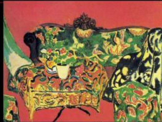
Севильский натюрморт. Розовая комната.