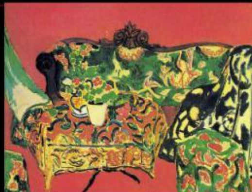
Севильский натюрморт. Розовая комната.