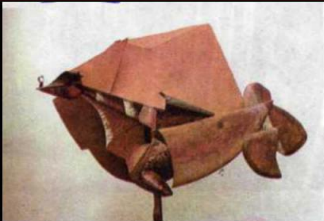
Конь + Всадник + Дом