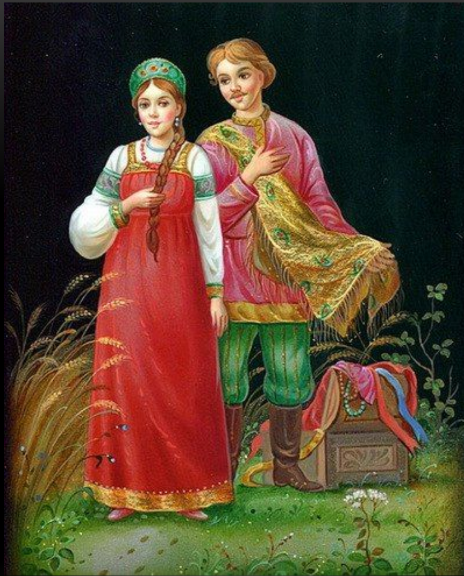
Н. А. Некрасов "Коробейники"