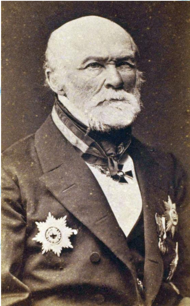
Никола́й Ива́нович Пиро́гов