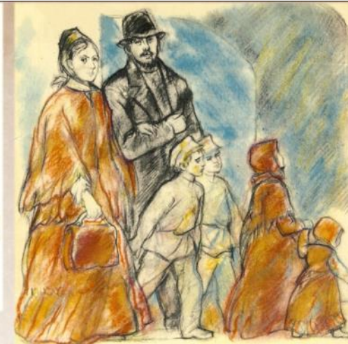
А. И. Куприн Чудесный доктор

Цель урока: провести нравственную оценку героев, выяснить какой рассказ называется рождественским.