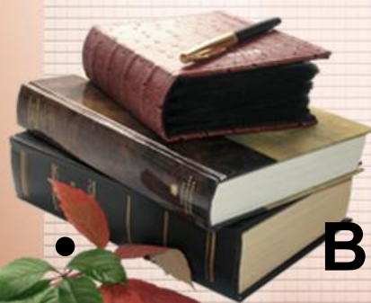
• Валентина Александровна Осеева