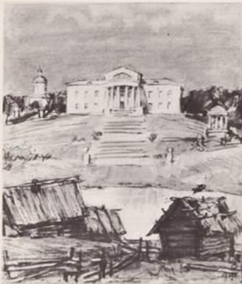
Открытка-иллюстрация к повести А.С.Пушкина «Дубровский». Художник Д.А. Шмаринов