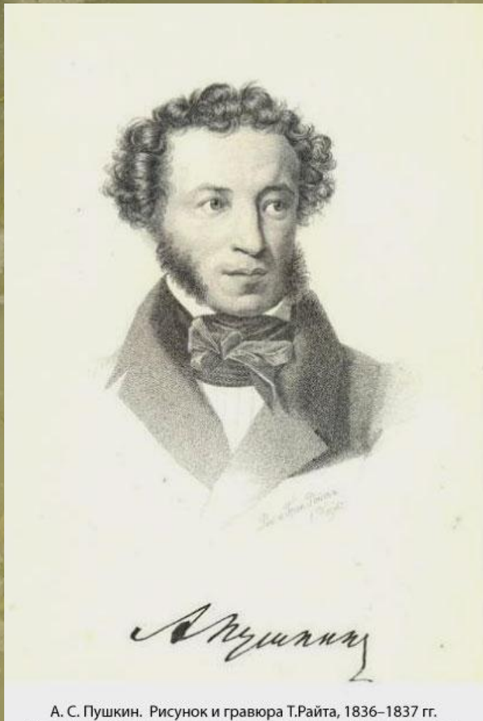
А. С. Пушкин. Рисунок и гравюра Т.Райта, 1836–1837 гг.