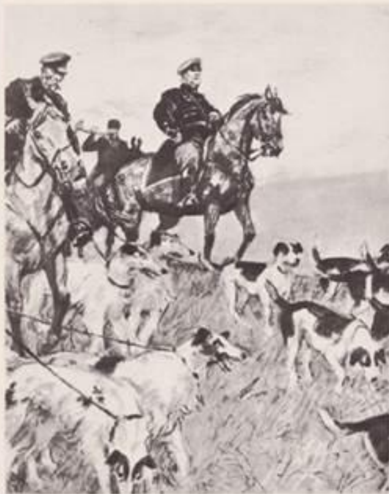
Открытка-иллюстрация к повести А.С.Пушкина «Дубровский». Художник Д.А. Шмаринов