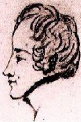
«Дубровский». Рисунок Пушкина.