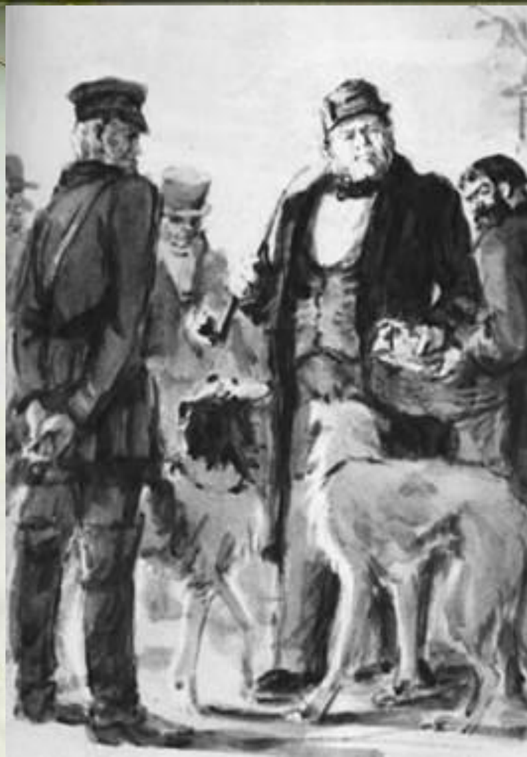
Открытка-иллюстрация к повести А.С.Пушкина «Дубровский». Художник Д.А. Шмаринов