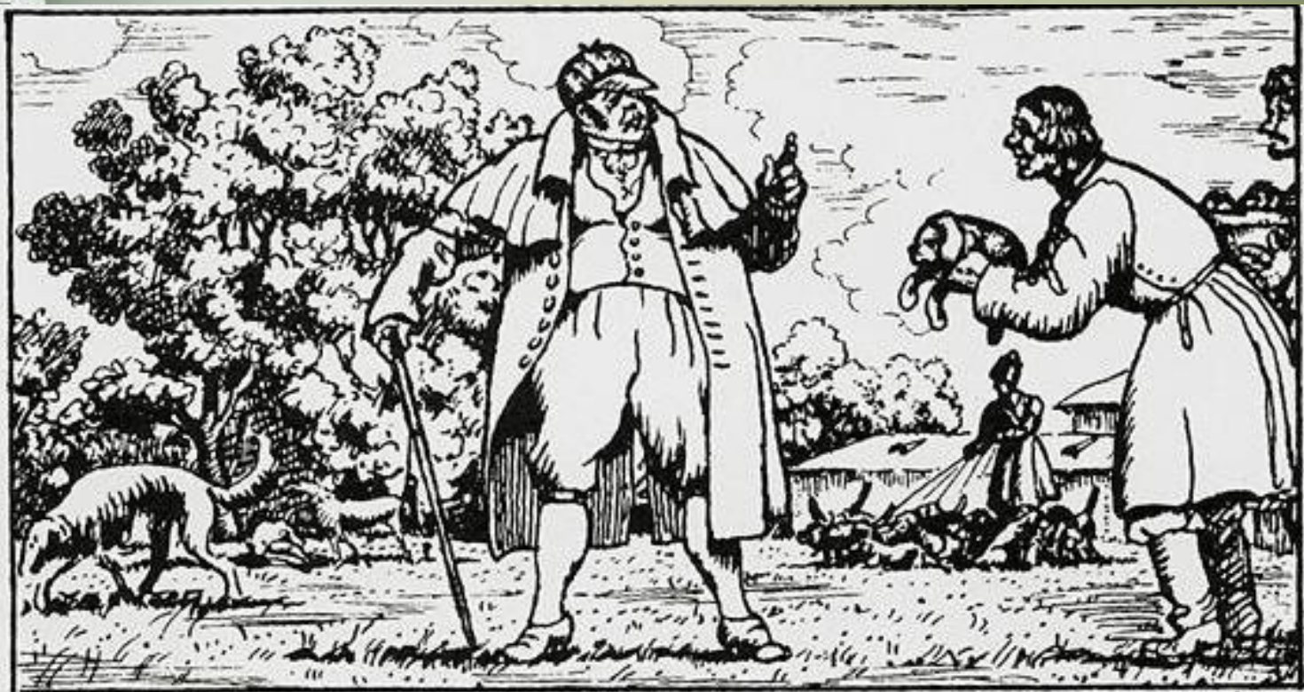
"Дубровский". Глава 1. На псарне у Троекурова. Б.М.Кустодиев 1919 г.