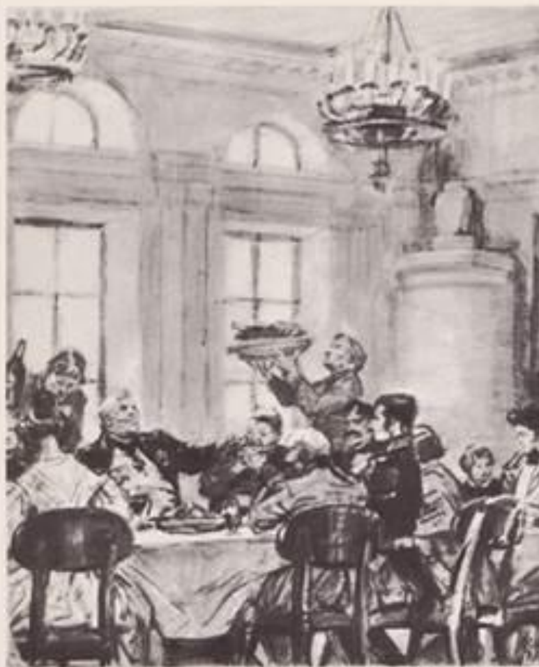
Открытка-иллюстрация к повести А.С. Пушкина «Дубровский». Художник Д.А. Шмаринов