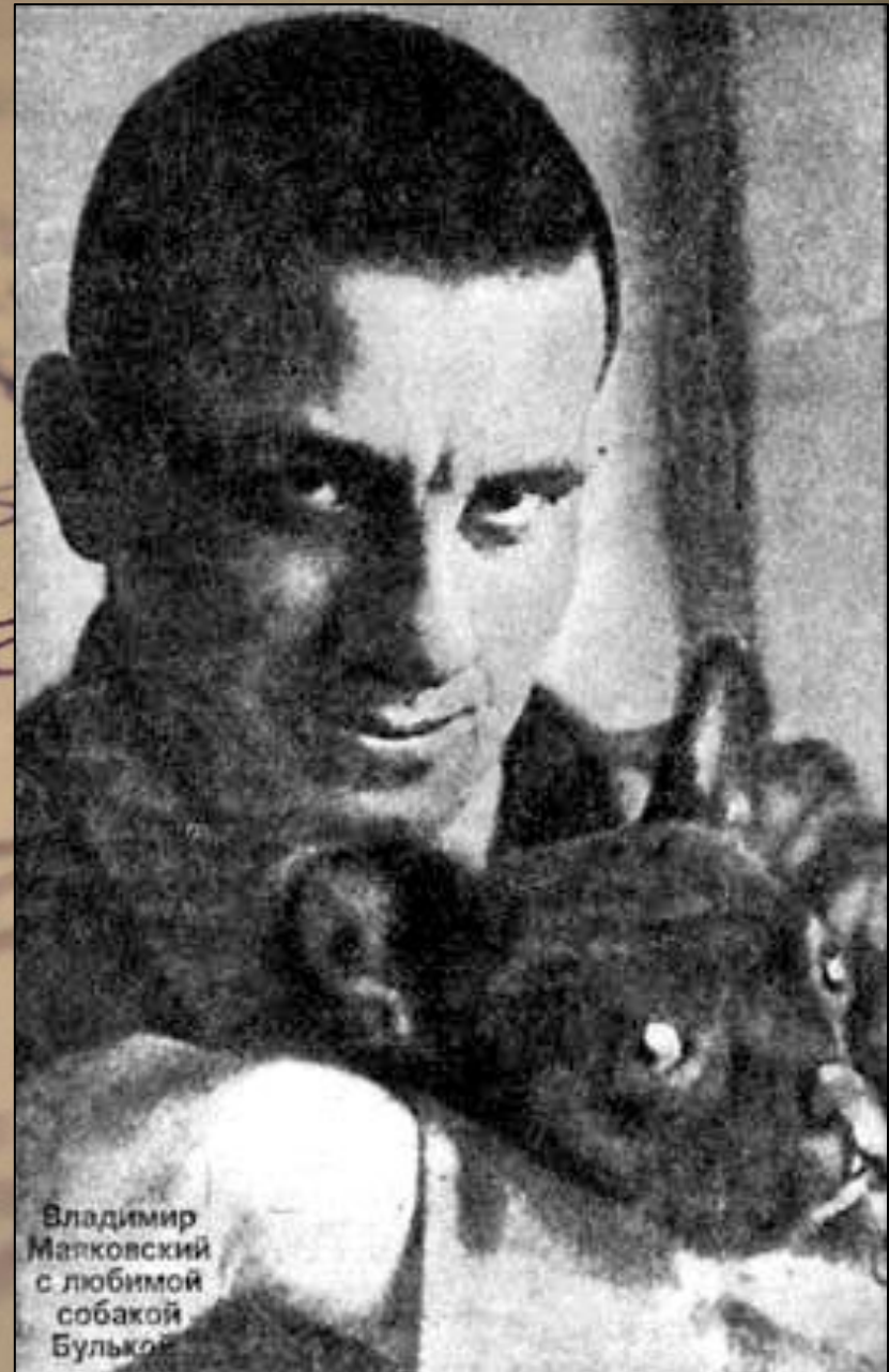
Владимир Маяковский с любимой собакой Булькой