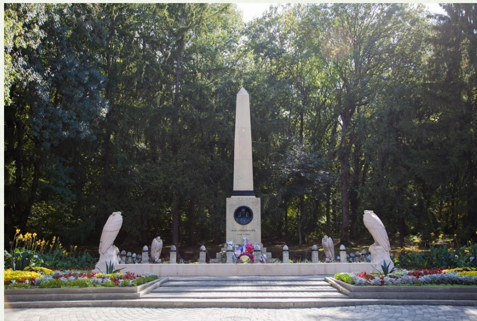
Памятник на месте дуэли М. Ю. Лермонтова

15 июля 1841 г. состоялась дуэль. Лермонтов был убит.