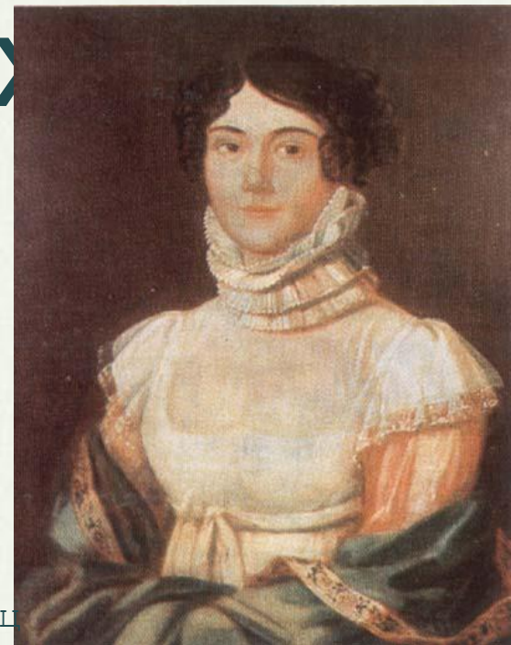
Мария Михайловна Лермонтова

Я сын страданья. Мой отец Не знал покоя по конец, В слезах угасла мать моя; От них остался только я, Ненужный член в пиру людском, Младая ветвь на пне сухом. «Стансы». 1831