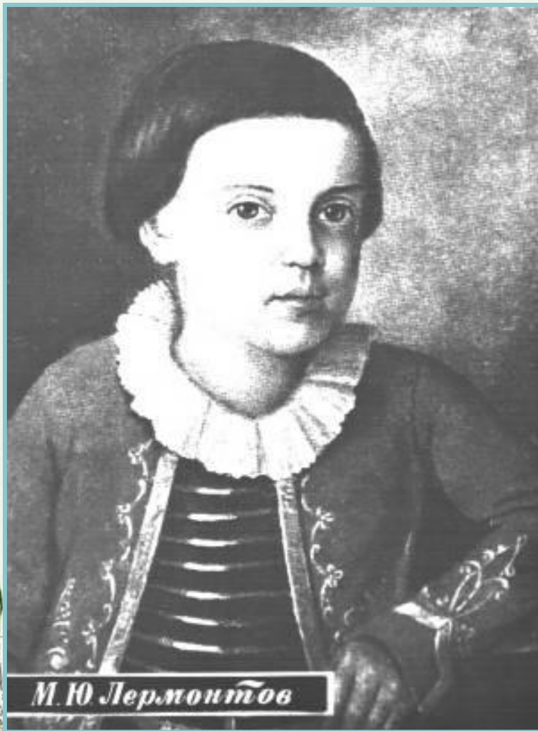
М. Ю. Лермонтов

В 1827 семья переезжает в Москву, а в 1828 Лермонтов зачисляется полупансионером в 4-й класс Московского университетского благородного пансиона, где получает гуманитарное образование