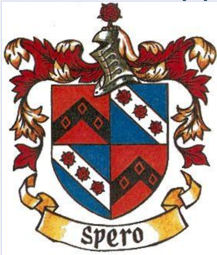
Герб рода Лермонтов

Герб Лермонтов из Балькоми (SPERO – 'Надеюсь'). Известно, что род Лермонтов пользовался этим гербом как минимум с 13-го века, но сам герб был зарегистрирован относительно поздно (по историческим меркам), а именно – в 1600 году.