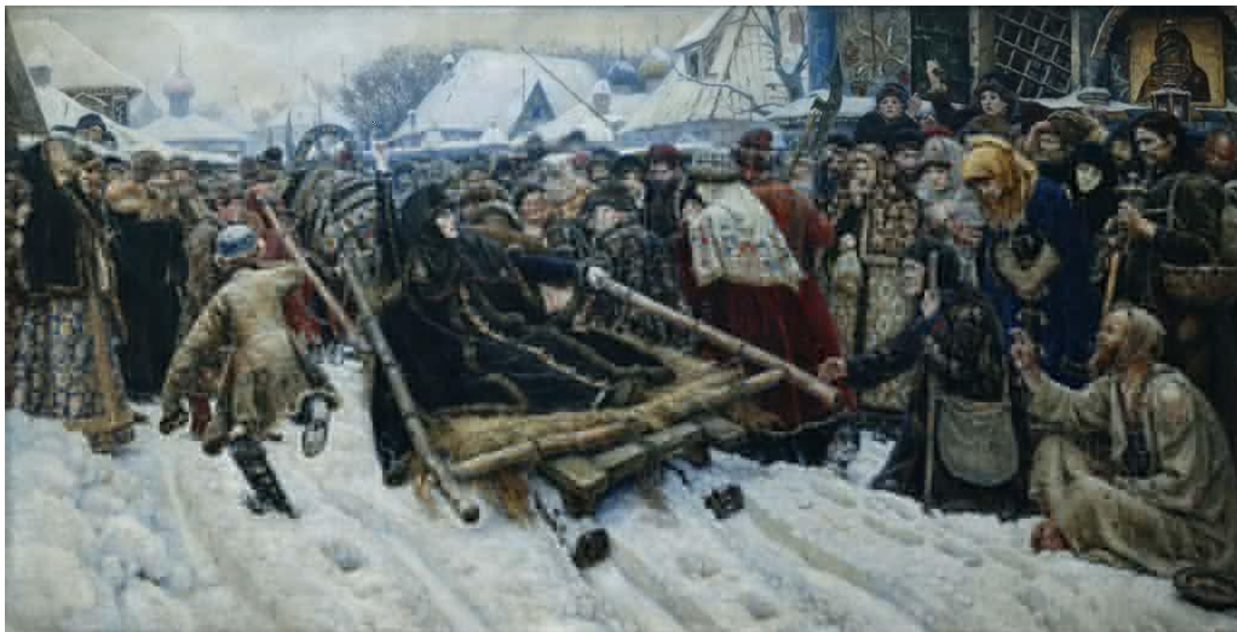
□ «Боярыня Морозова». Художник В. Суриков