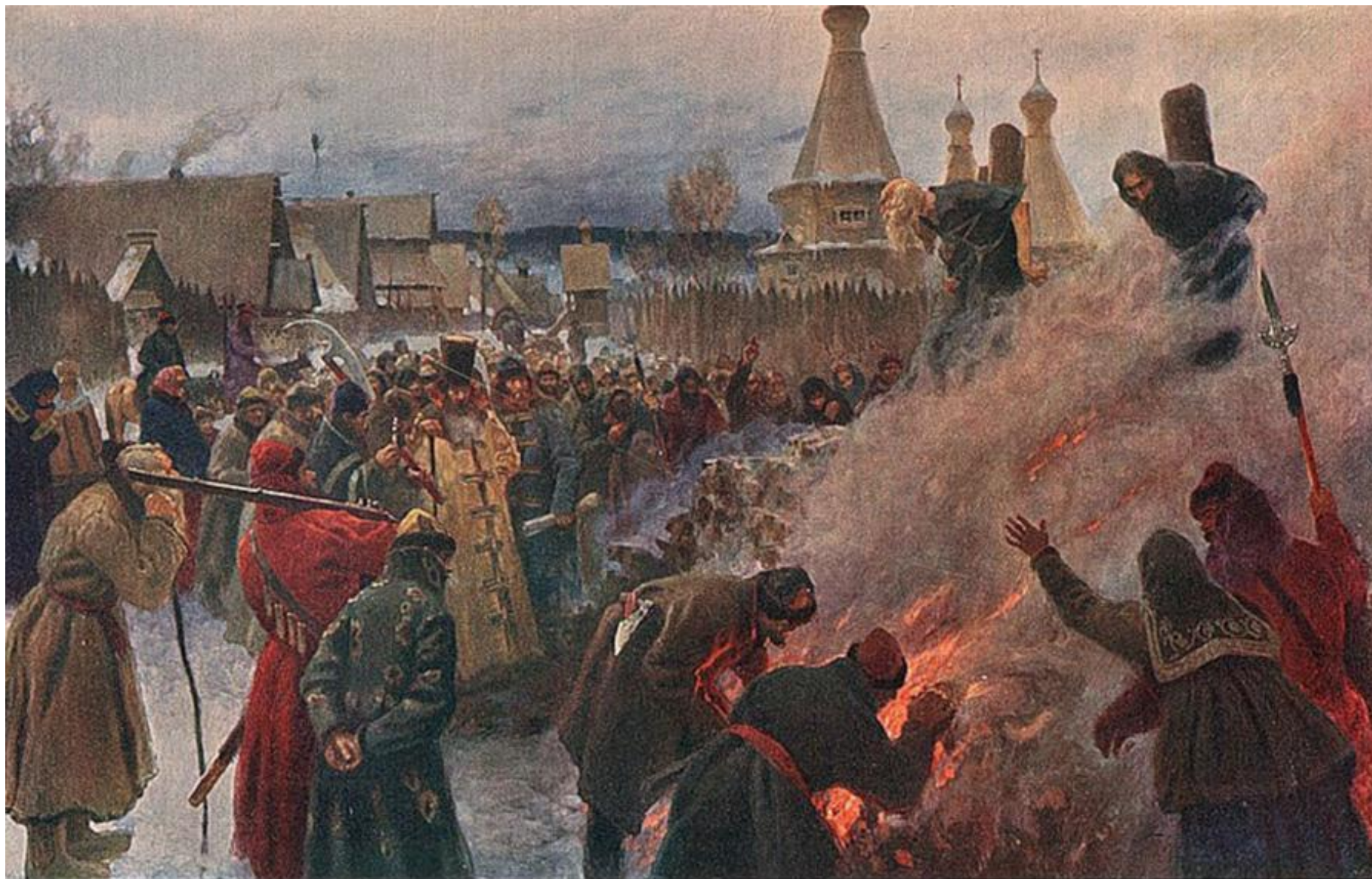
▣ Казнь Аввакума и его сподвижников