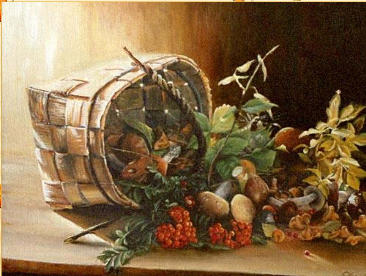
Г. ХВОЙНИКОВ «ЩЕДРЫЕ ДАРЫ ОСЕНИ»