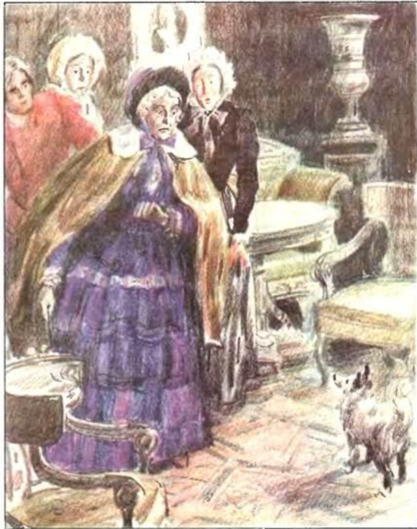
К. Трутовский. Иллюстрация к рассказу

Однажды барыня, увидев Муму, приказала привести её. При знакомстве, собака оскалила зубы, после чего барыня велела убрать со двора животное.