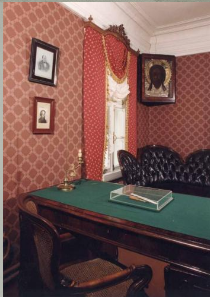
Кабинет И.С. Тургенева