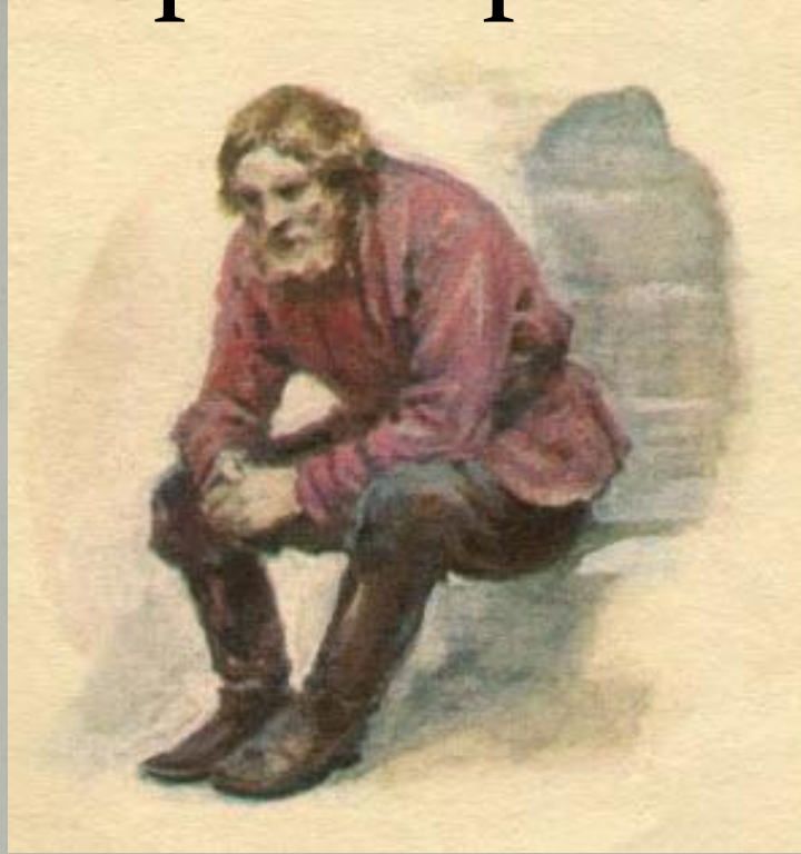
Художник Н. Ращектаев

«<...>Призванный сычевский староста объявил, что немой Андрей трезвый, работающий и необыкновенно во всем исправный мужик, несмотря на свой природный недостаток. <...> Она тут же решила взять немого во двор, в число своей личной прислуги и в звании дворника. И с этого дня он получил имя Немой»